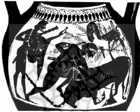
تصویر شماره ۴: نقاشی بر گلدانی یونانی (۵۳۰-۵۱۰ پیش از میلاد)، هرکول در حال کشتن گاو کرتی.

پشت او بز شاخ‌داری است که درختی همانند درخت زندگی از پشتش روییده است؛ درست مانند روییدن گیاه از پشت گاو در مَهری که در بالا شرح داده شد. نیز در تصویری که بعدها روی گلدانی (۵۳۰-۵۱۰ پیش از میلاد) از هرکول به همراه گاو کرتی نقش شده (تصویر شماره ۴) و از بدن گاو گیاه روییده است. تصاویری که به یک سنت مستمر اشاره دارد و نشان‌دهنده آن است که اصل حیات مجدد که پیش از این به ایزدبانوی دوجنسی تعلق داشته، بعد کاملاً در حیوان نر و ایزد نر جوان تجلی یافته است (Ibid: 135).