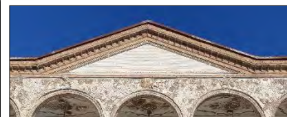
تصویر ۵: ستوری بالای نما Fig. 5: Pediment on top of the façade.