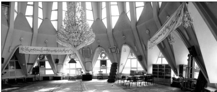
تصاویر ۵ و ۶: فضای داخلی و کالبد بیرونی مسجد الجواد میدان هفت تیر تهران Figs. 5 & 6: The interior and Exterior of Al-Jawad Mosque in Haft Tir Square, Tehran