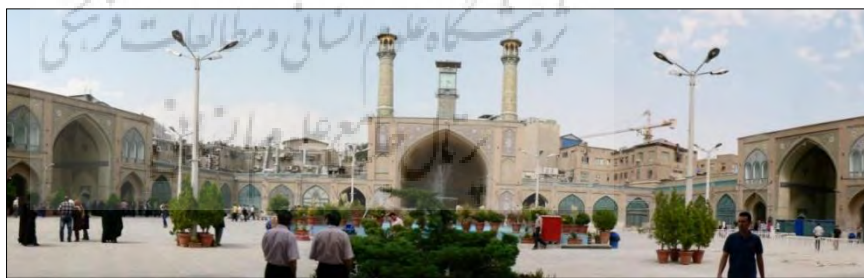
تصاویر ۱ و ۲: فضای داخلی و صحن اصلی مسجد امام تهران