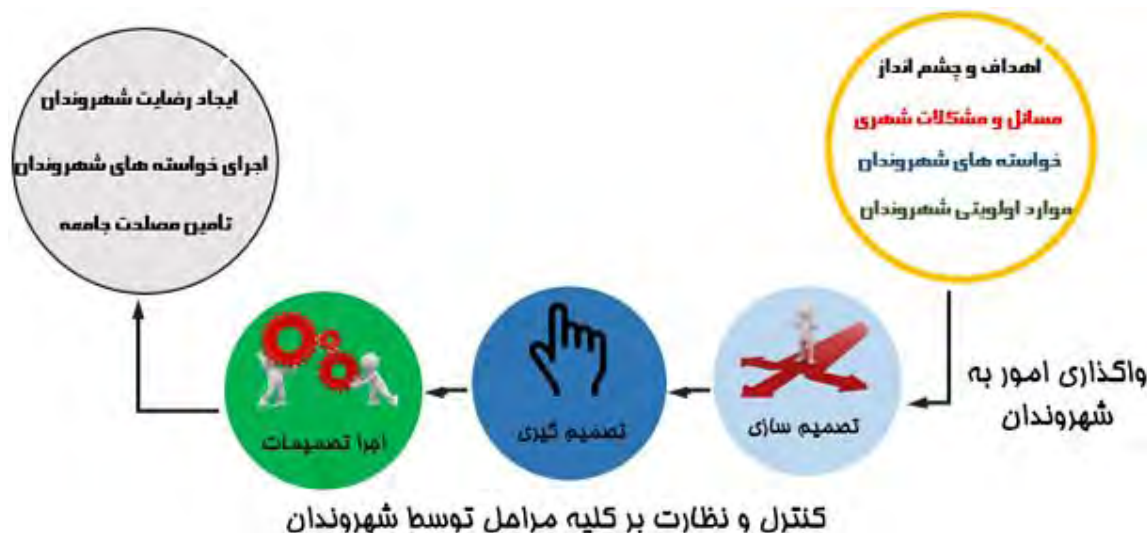
تصویر ۱: ساختار و الگوی مشارکت در مدیریت شهری اسلامی مفهومی و اولیه