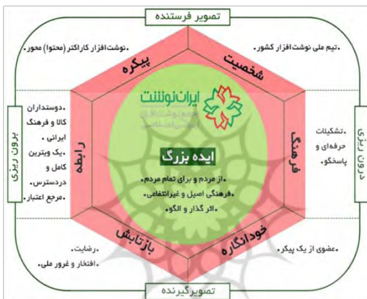
شکل ۴. الگوی هویت برند ایران‌نوشت

می‌توان منشور کاپفرر را با توجه به مفهوم «ایده بزرگ» ۱ که در برندسازی مطرح است، کامل‌تر کرد. ایده بزرگ یا همان «مفاهیم محوری هویت برند» به‌عنوان مظهر و نماد یک سازمان عمل می‌کند و استراتژی، رفتار، اقدام‌ها و ارتباطات پیرامون آن شکل می‌گیرد. این گزاره‌های ساده، در داخل سازمان به‌عنوان یک فرهنگ متمایز و در خارج از سازمان به‌عنوان یک مزیت رقابتی مورد توجه و استفاده قرار می‌گیرند و فرایند مدیریت برند از آن‌ها شروع می‌شود؛ بنابراین بر کل هویت برند مؤثر هستند. با نگاه به مضامین فراگیر احصاشده در هویت برند/ایران‌نوشت می‌توان الگوی هویت برند آن را مطابق شکل ۴، ترسیم کرد.