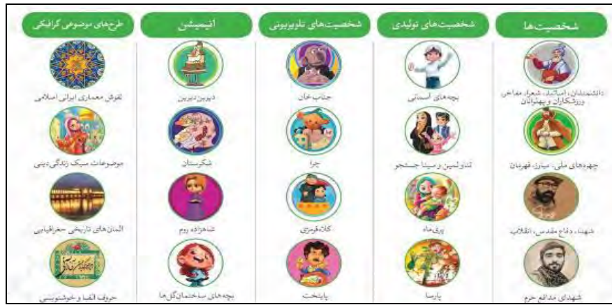
شکل ۲. دسته‌بندی نمادهای تولیدشده نوشت‌افزار ایرانی در سال‌های اخیر (مجمع ایران نوشت، ۱۳۹۶ الف)

در سال ۱۳۹۷ شخصیت‌های انیمیشن موفق «فیلمشاه»، پیشگام تولید و فروش طرح‌های نوشت‌افزار ایرانی - اسلامی شده‌اند. انیمیشنی که با فروش هشت میلیارد تومان، پرفروش‌ترین انیمیشن در تاریخ سینمای ایران از نظر ریالی و تعداد بیننده بوده است (ایزدخواه، ۱۳۹۷). موفقیت و عملکرد این مجموعه تولیدکنندگان و توزیع‌کنندگان به‌حدی بود که طی دیداری که مسئولان/ایران‌نوشت در مردادماه ۱۳۹۷ با رهبر معظم انقلاب داشتند، موردتقدیر ایشان قرار گرفتند و به این امر شدند که «نوشت‌افزار کشور را ایرانی کنید» (حسینی، ۱۳۹۷).