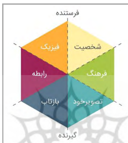
شکل ۱. منشور هویت برند (Kapferer, 2012)

می‌شود (Wheeler, 2018). هویت برند چارچوبی برای یکپارچگی نام تجاری ایجاد کرده و حدود جایگاه‌یابی برند را تعیین می‌کند. به تبع آن هویت برند برخی از جایگاه‌یابی‌ها را ممنوع و برخی را تضمین می‌کند (Kapferer, 2012). درمقابل مفهوم هویت برند، «تصویر برند» ۱ قرار دارد که دارای ماهیتی بیرونی است و در اذهان مخاطبان برند قرار دارد. تصویر هر برند عبارت است از: نحوه ادراک آن برند از سوی مصرف‌کنندگان (Heding, 2009)؛ به عبارتی «برند آن چیزی نیست که شما می‌گویید، آن چیزی است که آن‌ها (مخاطبان) می‌گویند» (DiResta, 2015). در خصوص رابطه این دو مفهوم کاپفرر (2012)، معتقد است که هویت الزاماً مقدم بر تصویر است. قبل از ترسیم یک ایده در ذهن عموم، نخست باید معلوم کرد که به‌طور دقیق چه چیزی باید ترسیم شود.