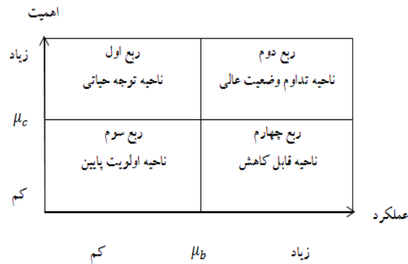
شکل ۱. ماتریس تحلیل اهمیت- عملکرد (Raymond & Choi, 2000)

ماتریس تجزیه و تحلیل اهمیت- عملکرد (IPA): در این پژوهش به منظور شناسایی نقاط ضعف شرکت‌های تولیدی کوچک و متوسط برای آمادگی صادراتی در صنایع مختلف و تعیین ناحیه توجه حیاتی مؤلفه‌های آمادگی صادراتی از روش ماتریس IPA استفاده شده است.