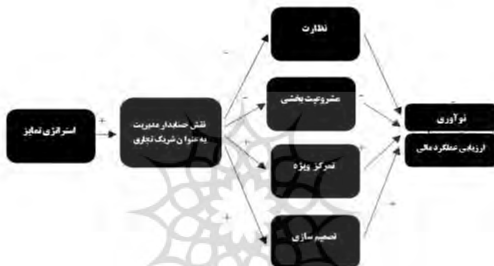
شکل (۱): مدل مفهومی پژوهش: (پاسچ، ۲۰۱۹) و (گیچاکا، ۲۰۱۴).

با توجه به فرضیه های مطرح شده، مدل مفهومی پژوهش به شکل زیر ترسیم می گردد: