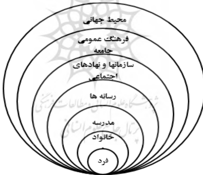
شکل ۱- مدل مفهومی از جایگاه مدرسه در فرهنگ - دیل و پیترسون- ۱۹۹۰

فرهنگ مدرسه را عامل پیونددهنده ای می دانند که معلمان، دانش آموزان، والدین و مدیران با نگاه، باور، درک و اعتقادات مشترک خود برای هرگونه هماهنگی در تعاملات مستمر به آن نیازمند هستند. فرهنگ محلی و ملی به صورتهای مختلف در فرهنگ مدارس انعکاس یافته است و پیشرفت مدارس مستلزم تأکید بر ارزشها، اعتقادات و هنجارهای مدرسه و نیز محیط خارج از مدرسه است (Deal and Patterson, 1990).