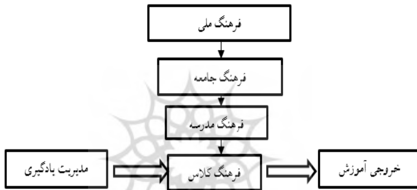
شکل-۲- مدل فرهنگ مدرسه (Chong- ۲۰۱۰)

سازمانی مدرسه به خود اختصاص داده است. چونگ (۲۰۱۰) در تحقیقات علمی خود در خصوص عوامل فرهنگی و اثربخشی آموزشی، به بررسی تفاوت های فرهنگی مدارس در کشورهای شرق و غرب پرداخته است. او اشاره می کند، توسعه سریع اقتصادی و اجتماعی در منطقه آسیا-اقیانوسیه در دهه های گذشته، فرایندهای مدرسه را تحت تأثیر قرار داده است و بنابراین درک عوامل فرهنگی یا متقابل با فرهنگ مدرسه را ضروری میدانند. وی مدل زیر را در خصوصیات تاثیرات فرهنگ مدرسه عنوان کرده است (Chong- 2010).