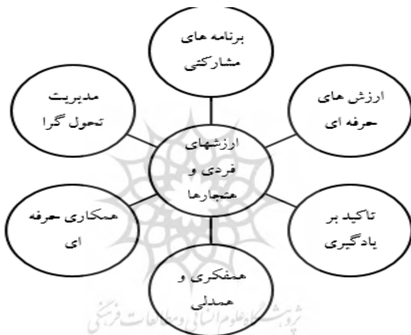
شکل ۳- مدل توسعه فرهنگ مدرسه (Cavanagh&Dellar, ۲۰۰۳)

رشد می دهد، حفظ می کند و تغییر شکل می دهد.۷. توجه به رفتارها، ارزش ها، هنجارها، نگرش ها، عقاید و دانش فردی و گروهی (Cavanagh& Dellar,2003). مدل وی نشان می دهد، رشد فرهنگی و بهبود مدرسه زمانی رخ می دهد که عناصر فرهنگی آن به خوبی توسعه یافته باشند و بهبود مدرسه موفق به استفاده از برنامه ریزی فرهنگی و استراتژی های اجرایی مناسب جامعه بستگی دارد(TSANG, 2009).