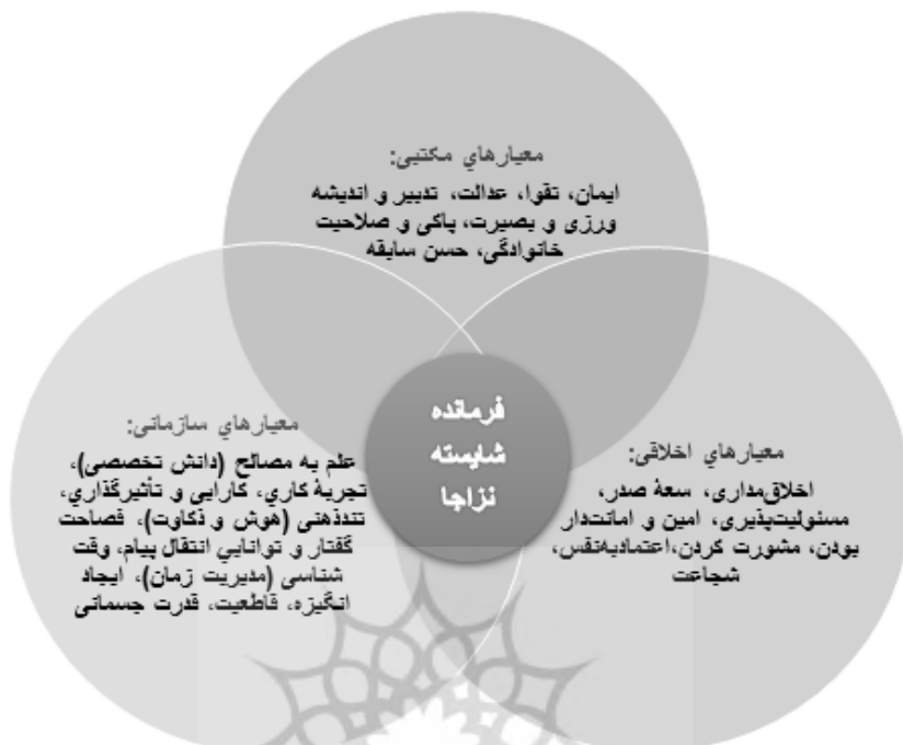
شکل شماره ۲: معیارهای شایسته‌گزینی فرماندهان نزاجا با تمرکز بر آموزه‌های نهج‌البلاغه