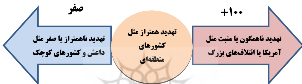
شکل شماره ۱: طیف تهدیدهای نظامی

کوچک مثل داعش و برخی از کشورهای همسایه هستند. به سمت وسط طیف تهدیدات منطقه‌ای هم‌تراز قرار دارند؛ مثل عربستان سعودی، ترکیه و ... هر چه به راست طیف برویم، تهدیدات ناهمگون و قوی‌تر مثل آمریکا و ناتو قرار دارند. بنابراین ج.ا.ایران بر خلاف سایر کشورها در هر دو سر طیف مورد تهدید است، پس هم نیاز به گردان جهت سر منفی طیف دارد و هم نیاز به لشکر جهت سر مثبت طیف دارد.