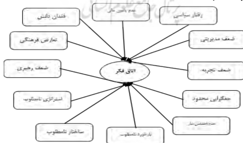
شکل ۱. موانع شکل‌گیری اثربخش اتاق فکر از منظر صاحب‌نظران

جهت سنجش پایایی از روش آزمون-پس‌آزمون استفاده شده و پرسش‌نامه در بازه زمانی ۳ هفته بعد مجدداً برای اساتید دانشگاهی و تعدادی از خبرگان با تجربه در حوزه پژوهش ارسال شد. همبستگی میان پاسخ‌ها در دو مرحله می‌بایست بالاتر از ۰/۷ باشد. حاصل شود تا پایایی پرسشنامه مورد تأیید قرار گیرد (یونوس و خان، ۲۰۱۱). همبستگی موردنظر به میزان ۷۴ درصد برآورد شد که نشان از تأیید پایایی پرسشنامه دارد.