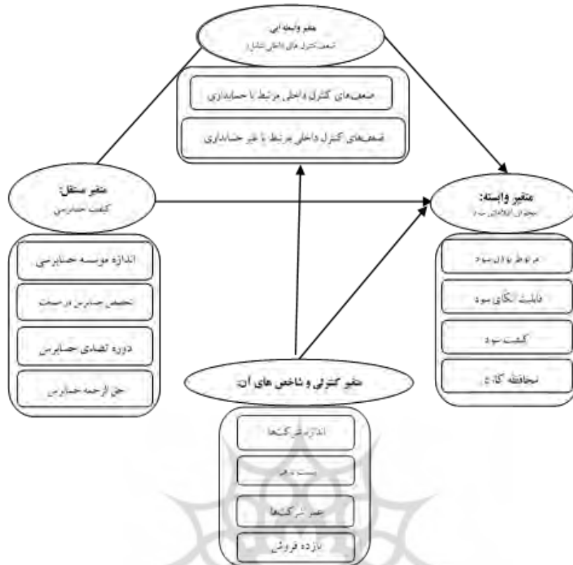
شکل (۱): الگوی مفهومی پژوهش

شرکت‌های پذیرفته شده در بورس اوراق بهادار تهران، جامعه آماری پژوهش حاضر را تشکیل می‌دهد. بازه زمانی مورد مطالعه نیز، دوره ۱۰ ساله بین سال‌های ۱۳۸۶ تا ۱۳۹۵ است. در این پژوهش از نمونه‌گیری آماری استفاده نمی‌شود؛ اما شرایط زیر برای انتخاب نمونه قرار داده می‌شود و نمونه پژوهش بر این اساس انتخاب شده است: