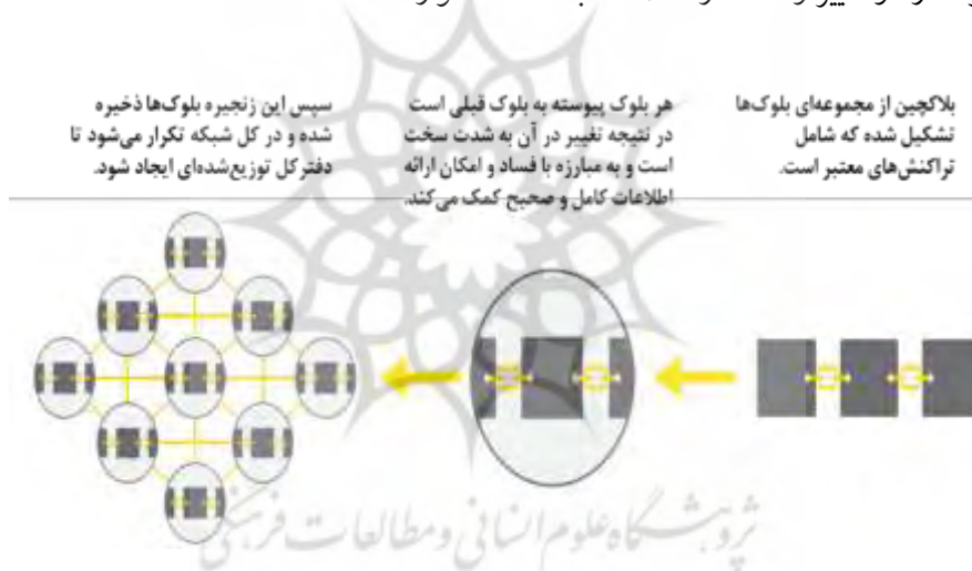
شکل ۳: ساختار دفتر کل توزیع شده (برودی و همکاران ۲ ، ۲۰۱۷)

(لورنز و همکاران ۱ ، ۲۰۱۶). در فناوری بلاکچین، دفتر کل، اصلی‌ترین نگه‌دارنده سوابق است که لیست بلوک‌ها را نگهداری می‌کند. هر بلوک، داده و یا اطلاعات را ذخیره می‌کند. این داده و اطلاعات می‌توانند هر مختصات و کیفیتی داشته باشند. در حالت معمولی، یک دستگاه مرکزی قرار دارد که مسئول تمام داده‌ها است و می‌تواند هر کاری که بخواهد با آن‌ها انجام دهد. بلاکچین مبتنی بر یک دفتر کل توزیع شده و غیرمتمرکز است. به عبارتی تعداد زیادی دستگاه وجود دارد که به صورت هم‌تا به هم‌تا به یکدیگر متصل هستند؛ بنابراین این سیستم متمرکز نیست و تمام این دستگاه‌ها یک نسخه از دفتر کل را دارند (بونگر، ۲۰۱۷). در شکل ۳ ساختار یک دفتر کل توزیع شده تشریح شده است. با توجه به این ساختار مشخص است که اطلاعاتی که در هر بلوک تعریف می‌شود به بلوک قبلی وابسته است و یک نسخه توزیع شده وجود دارد و تغییر و فساد در اطلاعات به شدت دشوار است.