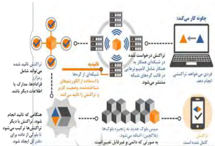
شکل ۴: شیوه کارکرد بلاکچین (هافمن و همکاران، ۲۰۱۸)

بلاکچین یک فناوری امن است. به‌طور معمول، پرسیده می‌شود که اگر بلاکچین توزیع شده است، پس چگونه می‌تواند بستری امن را فراهم کند؟ نکته اینکه در فناوری بلاکچین، از کریپتوگرافی برای تولید امضای دیجیتال استفاده می‌شود. امضای دیجیتال شامل این دو مورد می‌شود: "کلید خصوصی" و "اطلاعات یا داده‌ای که قرار است در شبکه منتقل شود". کلید خصوصی، تنها توسط صاحب آن قابل دسترسی است؛ اما هر یک از افراد شبکه به کلید عمومی سایر افراد شبکه دسترسی دارد. در فرآیند تشکیل امضای دیجیتال و ارسال آن به شبکه بلاکچین، این امضای دیجیتال توسط شبکه و با استفاده از کلید عمومی فرد ارسال‌کننده، رمزگشایی و اطلاعات از امضا جدا می‌شود. اگر اطلاعات اصلی با اطلاعاتی که از کلید عمومی رمزگشایی شده است یکی باشد، این تراکنش تایید می‌شود و در غیر این صورت تراکنش رد می‌شود و انجام نمی‌پذیرد. اگر اطلاعات رمزگشایی شده با اطلاعات اصلی