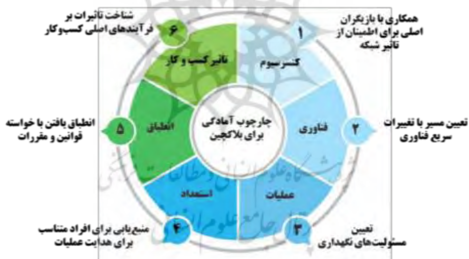
شکل ۵: چارجوب آمادگی بلاکچین بر اساس سؤالات اصلی (پیسکینی و همکاران ۲ ، ۲۰۱۸)

البته بسته به حساسیت موضوع می‌توان طیف متنوع‌تری از سؤالات و ملاحظات را در نظر گرفت. به‌طور مثال، پیشنهاد شده است برای طراحی یک راهبردی تجاری برنده در بلاکچین مجموعه‌ای از ملاحظات و سؤالات کلیدی پیش از شروع هر اقدامی مورد توجه قرار گیرند. در اصل، شش گروه موضوعی (مطابق شکل ۴) در آمادگی برای بلاکچین مدنظر قرار گرفته و سؤالات مربوطه ذیل هر کدام از این گروه‌ها طرح و بررسی شوند. در ادامه متناسب با هر سؤال و جواب مربوطه می‌بایست سازوکاری فعال شود که فرصت‌ها را ارزیابی کند. پیش‌بینی می‌شود اگر پیش از هرگونه فعالیت اجرایی، پاسخ این سؤالات مشخص شود شانس موفقیت از حصول نتیجه و انتفاع از مزایای بلاکچین، افزایش می‌یابد. البته راه‌اندازی یک مدل عملیاتی شفاف و سازمان‌دهی یک کنسرسیوم جامع به‌طور مؤثری، مشکلات بعدی را در زمینه اداره پلفرم و مسئولیت‌های آن مرتفع می‌کند.