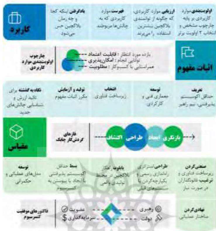
شکل ۶: نقشه راه اجرای بلاکچین (پیسکینی و همکاران، ۲۰۱۸)