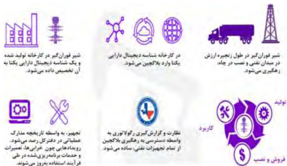
شکل ۲: تحول کل زنجیره ارزش با بلاکچین - مثال مدیریت چرخه عمر تجهیزات نفتی (مسزروس، ۲۰۱۷)

مثال دیگر در رابطه با استفاده شرکت‌های نفت و گاز از قراردادهای هوشمند است. منظور از قراردادهای هوشمند، قراردادهای خودتائید و خودمختاری است که هنگام تعهد به فروشندگان و شرکت‌های EPC، به صورت خودکار و مستقل عمل می‌کنند. در یک شرکت نوعی، هنگام تائید یک محموله دریایی، قراردادهای هوشمند پیشرفته می‌توانند جریان نقدی را تحقق بخشند. حتی این قراردادها قادرند تا اگر سطح هزینه‌ها و یا حجم مواد به میزان خاصی رسید، برای تهیه مواد اولیه پرداخت انجام دهند. قرارداد به صورت خودکار شرایطش را درست زمانی که الزامات برقرار شوند اجرا می‌کند و دخالت نیروی انسانی را در تکمیل یک قرارداد کاهش می‌دهد. علاوه بر این بلاکچین می‌تواند در زنجیره ارزش صنعت نفت و گاز و مدیریت چرخه عمر تجهیزات نفتی، تغییرات زیادی ایجاد کند (نیلفروشان و فرزامی، ۱۳۹۷). تغییر و تحول ناشی از بلاکچین نیازمند آمادگی است و این آمادگی می‌تواند شرایط پذیرش و پیاده‌سازی بلاکچین را تسهیل نماید. از جمله این آمادگی‌ها می‌توان به ساختاردهی قوانین و مقررات، شیوه همکاری ذی‌نفعان و آمادگی انطباق و انعطاف‌پذیری سیستم اشاره کرد.