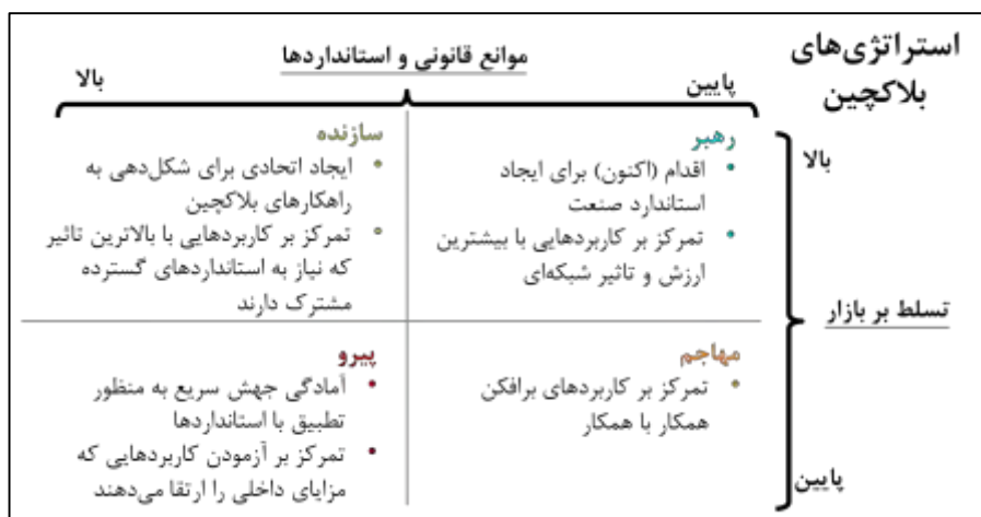
شکل ۵: انتخاب استراتژی مناسب برای بلاکچین (کارسون و همکاران، ۲۰۱۸)

شکل فوق در ظاهر چهار حوزه مجزای راهبردی برای توسعه فناوری بلاکچین است اما در عمل بر اولویت‌بندی موارد کاربردی با توجه به موقعیت شرکت‌ها، تأکید دارد؛ بنابراین مدیران می‌توانند از محیط درونی و بیرونی خود کسب اطلاع کرده و بسته به نتایج آن، حوزه کاربردی خود را برگزینند.