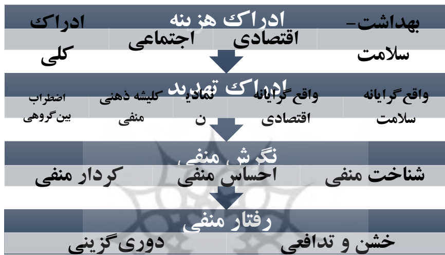
شکل ۲- مدل شکل‌گیری رفتار منفی جامعه میزبان نسبت به گردشگران در شرایط شیوع کرونا مبتنی بر نظریه تهدید یکپارچه

با کدگذاری باز (استخراج مفاهیم)، کدگذاری محوری (استخراج مقوله‌ها) و نیز مشخص بودن عناصر بر اساس نظریه تهدید یکپارچه، مدل روند شکل‌گیری رفتار منفی جامعه میزبان (ساکنان رامسر) نسبت به گردشگران در شرایط شیوع کرونا مبتنی بر نظریه تهدید یکپارچه به دست آمد که در شکل (۲) نمایش داده شده است.