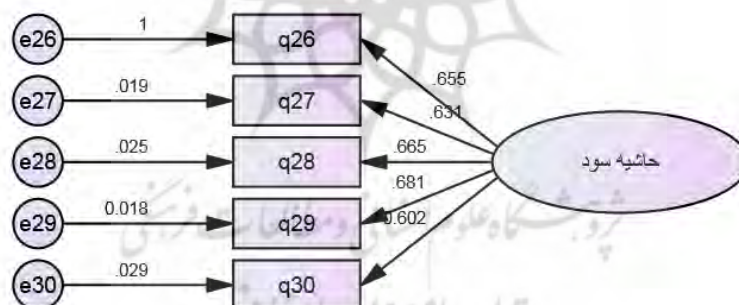
نمودار شماره (۳): نمای مدل ساختاری حاشیه سود

در جدول ۶ بارهای عاملی و نسبت‌های بحرانی حاشیه سود به‌عنوان یکی از متغیرهای پژوهش مشاهده می‌شود. توجه به قواعد و مقررات آماری در این جدول مبین قرار گرفتن تمامی مقادیر در بازه‌های مجاز می‌باشد و می‌توان از این نتایج برداشت نمود که سازه پرسشنامه در مورد این متغیر دارای برازش مناسبی است. مدل ارائه شده در نمودار ۳ نمایشگر بررسی برازش متغیر حاشیه سود می‌باشد.