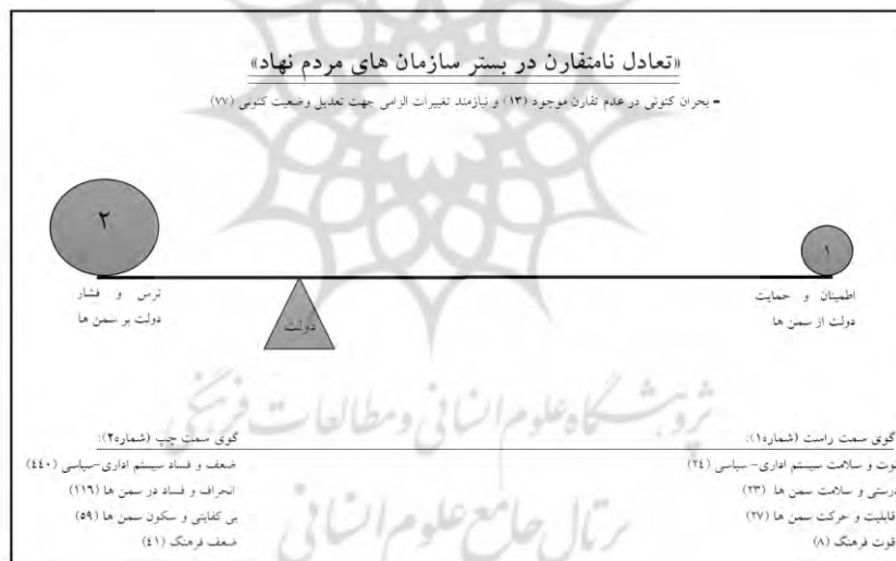
شکل ۱. مدل نهایی پژوهش

این مدل پدیده سازمان‌های مردم‌نهاد و بستر آن را، که دربردارنده بستر اداری-سیاسی و بستر فرهنگی و ... است، در قالب تعادلی نامتقارن به شکل الاکلنگی تصویر کرده است. به عبارت دیگر، این مدل الاکلنگی هم‌اکنون در نقطه تعادلی قرار دارد؛ نقطه‌ای که در آن گوی سمت چپ به مراتب بزرگ‌تر از گوی سمت راست است و مثلث نگه‌دارنده به سمت چپ متمایل شده است. در حقیقت، قرار گرفتن مثلث در سمت چپ بار گوی سمت چپ را تحمل کرده و تعادل سیستم را موجب شده است. در مجموع، مدل حاصل نشان می‌دهد این پدیده و بستر آن در عین عدم تقارن متعادل است.