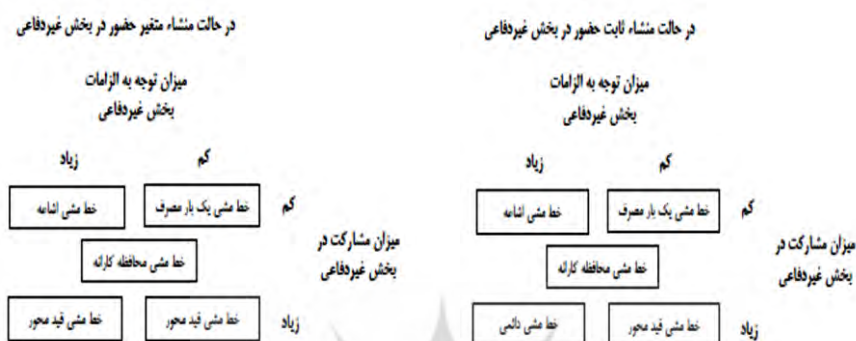
شکل ۳. ماتریس‌های شناسایی حالات تدوین خط‌مشی دومنظوره‌سازی صنعت دفاعی ایران (برگرفته از تقابل عناصر مدل)

موجود در صنعت دفاع ( با عنوان پیشران‌های ثابت) و همچنین از طریق مطالعه دلایل دومنظوره‌سازی صنعت دفاعی با بررسی عوامل نوظهور در صنعت دفاع ( با عنوان پیشران‌های متغیر) و همچنین میزان توجه و گرایش به عوامل و الزامات درون صنعت دفاع و یا بیرون صنعت دفاع (با عنوان راهبردها و شرایط یکپارچگی با بخش دفاعی و بخش غیردفاعی) و میزان مشارکت صنعت دفاع در بخش غیردفاع (با عنوان زمینه‌سازها و وضعیت محیطی آن) حالت‌ها یا گونه‌های ممکن خط‌مشی دومنظوره‌سازی صنعت دفاعی بر اساس دو ماتریس و جدول زیر شناسایی می‌شود.