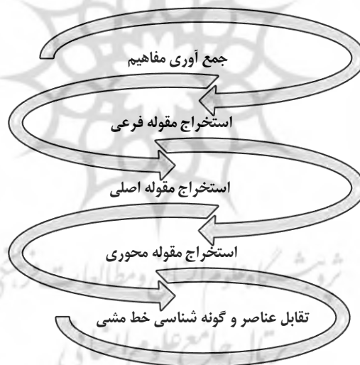
شکل ۱. مراحل جمع‌آوری، دسته‌بندی، ترکیب و شکل‌دهی به مقولات

مرحله ششم: گزارش دهی. مرحله ششم زمانی شروع می‌شود که پژوهشگر مجموعه‌ای از تم‌های کاملاً مناسب در اختیار داشته باشد. این مرحله شامل تحلیل پایانی و نگارش گزارش است. به‌طورکلی تحلیل محتوای کیفی به پژوهشگران اجازه می‌دهد اصالت و حقیقت داده‌ها را به گونه ذهنی، ولی با روش علمی تفسیر، کنند. عینیت نتایج به وسیله وجود یک فرآیند کدبندی نظام‌مند تضمین می‌شود (Bazargan, 2015). تحلیل محتوای کیفی به فراسویی از کلمات یا محتوای عینی متون می‌رود و تم‌ها یا الگوهای را که پنهان هستند به‌صورت محتوای آشکار معرفی می‌کند. به‌طور خلاصه، روش جمع‌آوری، تحلیل و طبقه‌بندی داده‌های پژوهش با تکنیک تحلیل تم برای ساخت مدل به‌صورت شکل ۱، خلاصه شده است.