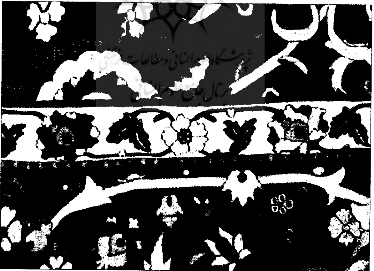
قسمتی از واگیره حائسبه کوچک دوم قالی