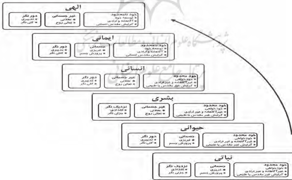
شکل ۲. نمای کلی الگوی انگیزش‌گرایش محور (جوادی، ۱۳۹۸: ص ۱۷۲)

در این قسمت، ابتدا به طرح الگوی انگیزش‌گرایش محور مبتنی بر نظریه رشد پرداخته می‌شود؛ پس از آن بین این الگوی پیشنهادی با الگوهای پیشین از جهت مبانی مقایسه صورت می‌پذیرد. در شکل ۲ الگوی انگیزش‌گرایش محور به نمایش گذاشته شده است. همان‌طور که در شکل مشاهده می‌شود، این الگو دارای شش بعد گرایشی-انگیزشی است و مبتنی بر نظریه انسان‌شناسی «انسان فطرت‌گرا» تولید شده است. هر بعد از ترکیب سه مؤلفه تشکیل می‌شود و هر مؤلفه شاخص خاص خود را دارد که در اینجا به دلیل رعایت حجم و مأموریت این نوشتار از توضیح تک‌تک شاخص‌ها خودداری می‌شود و تنها ابعاد و مؤلفه‌ها شرح داده می‌شود.