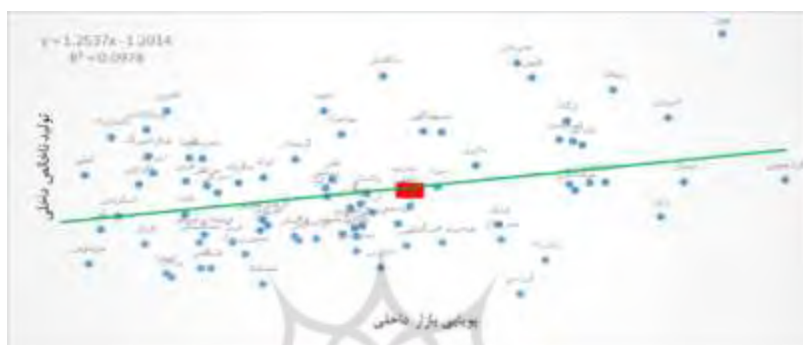
شکل ۹- تأثیر پویایی بازار داخلی بر تولید ناخالص داخلی

یعنی سطح تغییر سالانه بازار. با توجه به شکاف ورود به صنعت و فرصت‌های موجود، شرایط انگیزشی درون شرکت، درجه‌ای را که شرکت‌ها در برابر کشش به فرصت‌های کسب سود و فشار ترس از عقب افتادن از شرکت‌های رقیب، تعیین کند. شرایط انگیزشی درون شرکت خودش، توسط تعداد شرکت‌های حاضر در صنعت، ماهیت ساختار بازار، و انرژی و اهداف کارآفرینان در این شرکت‌ها تعیین می‌شود که به نوبه خود میزان رقابت بین شرکت‌ها را تعیین می‌کند (لیبنشتاین، ۱۹۶۸).