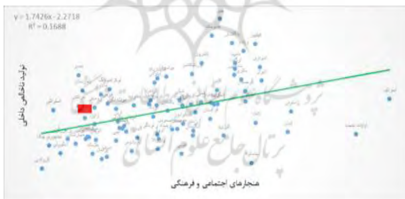
شکل ۱۲- تأثیر هنجارهای اجتماعی و فرهنگی بر تولید ناخالص داخلی

فرهنگ مجموعه‌ای از ارزش‌ها، نگرش‌ها، هنجارها و رفتارهایی است که هویت یک جامعه را تشکیل می‌دهند. کارآفرینان به‌عنوان بخشی از جامعه پیرامونی، از ارزش‌ها، نگرش‌ها، هنجارها و رفتارهای متمایزی برخوردارند که می‌توان به آن خرده‌فرهنگ کارآفرینی اطلاق نمود. بر اساس اصل تأثیر متقابل حوزه‌های مختلف فرهنگ و اجتماع، فرهنگ کارآفرینی از حوزه‌های دیگر فرهنگ، از جمله حوزه اخلاق و مذهب، ارزش‌ها، عقاید اقتصادی و سیاسی تأثیر می‌پذیرد. از این رو ریشه‌های ضعف و قوت فرهنگ کارآفرینی را باید در حضور و وجود ارزش‌ها و عقایدی جستجو کرد که در فرهنگ و در سلسله‌مراتب ارزش‌ها، جایگاهی فراتر از کار را به خود اختصاص داده‌اند و در تعارض و تقابل با کار و یا هم‌نوا و همساز با کارآفرینی هستند. با توجه به استدلال برخی محققان، نقش کارآفرینی در جوامع مختلف با توجه به تنوع فرهنگی متفاوت است. منابع طبیعی و سرمایه نقدی ممکن است یکسان باشد، اما آنچه باید در درک تفاوت رفتار، مورد توجه قرار گیرد، عواملی است همچون: عقاید اجتماعی، هنجارها، پاداش رفتارها، آرمان‌های فردی و ملی و مکاتب دینی (مک‌گوایر و همکاران، ۱۹۶۲). بنابراین اگرچه کارآفرینان، ارزش‌ها و باورهایی متمایز از افراد جامعه دارند، ولی فرهنگ کارآفرینی، متأثر از فرهنگ حاکم بر جامعه است. در واقع هرچه ارزش‌ها و عقاید موجود در جامعه، افراد جامعه را به کار، تولید مداوم، فکر و اندیشه خلاق و یادگیری و کسب دانش سوق دهند، در آن جامعه فرهنگ کارآفرینی اشاعه یافته و درون افراد نهادینه می‌شود و یا به عبارتی، در آن جامعه افراد بیشتری دست به خلاقیت، نوآوری و کارآفرینی می‌زنند و افراد کارآفرین بیشتری موفق می‌شوند که ایده‌های نوین خود را در جامعه محقق سازند.