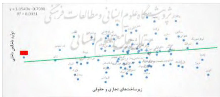
شکل ۸- تأثیر زیرساخت تجاری و حقوقی بر تولید ناخالص داخلی

زیرساخت‌های تجاری و حقوقی شامل خدمات تجاری است که برای مدیریت شرکت‌های کارآفرینی لازم است. خدمات تجاری شامل در دسترس بودن پیمانکاران، تأمین‌کنندگان، مشاوران و خدمات حقوقی شامل حسابداری، تبلیغات، امور مالی، مخابرات، اینترنت و خدمات بانکی است. خدمات کسب‌وکار یا حرفه‌ای در طول فرآیند کارآفرینی، به‌ویژه در مدیریت و بهره‌برداری از شرکت‌ها مفید است (سوزوکی و همکاران، ۲۰۰۲). در دسترس بودن مناسب خدمات کسب‌وکار، بنگاه‌های کارآفرین را قادر می‌سازد تا بر کسب‌وکار اصلی خود تمرکز کنند و در نتیجه بهره‌وری و صرفه‌ی ناشی از تخصص به دست آورند. از جمله خدمات موردنیاز در طول فرآیند تشکیل شرکت خدمات حقوقی است. از آنجاکه کمبود خدمات حقوقی وجود دارد، این وضع می‌تواند مانع کارآفرینی شود (رووف، ۲۰۰۵).