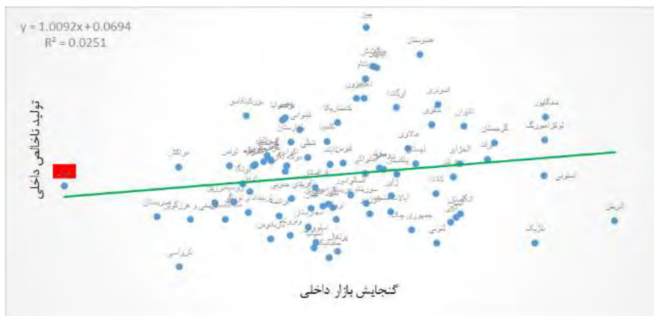
شکل ۱۰- تأثیر گنجایش بازار داخلی بر تولید ناخالص داخلی

شکل (۱۰) بیانگر ارتباط مثبت بین گنجایش بازار داخلی با تولید ناخالص داخلی می‌باشد. بدان معنی که کشورهایی که بازار داخلی بازتری داشته‌اند رشد اقتصادی بهتری را نیز تجربه کرده‌اند. کشورهای سنگاپور و استونی بازار داخلی بازتر و رشد اقتصادی بیشتر را داشته‌اند. ایران نیز که در شکل با رنگ قرمز مشخص شده است دارای شرایط مطلوبی نمی‌باشد.