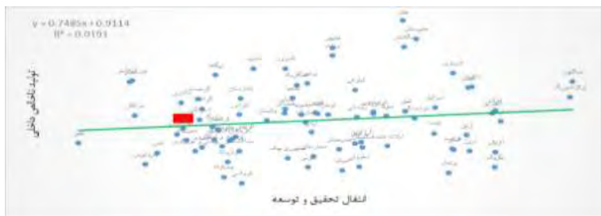
شکل ۷- تأثیر انتقال تحقیق و توسعه بر تولید ناخالص داخلی

در شکل (۷)، انتقال تحقیق و توسعه دارای رابطه‌ی مثبت با تولید ناخالص داخلی می‌باشد. این بدان معنی است که کشورهای که انتقال تحقیق و توسعه مناسب‌تری داشته‌اند رشد اقتصادی بهتری را نیز تجربه کرده‌اند. کشورهای سنگاپور و لوکزامبورگ انتقال تحقیق و توسعه مناسب‌تر و رشد اقتصادی بیشتر را داشته‌اند.