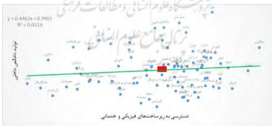
شکل ۱۱- تأثیر دسترسی به زیرساخت‌های فیزیکی و خدماتی بر تولید ناخالص داخلی

سهولت دسترسی به منابع فیزیکی مانند ارتباطات، آب و برق، حمل و نقل، زمین و فضا در ازای مبلغ متناسب برای کسب و کارهای کوچک و متوسط (گزارش سالانه ۱ GEM). در مقایسه با زیرساخت‌های تجاری و قانونی و مقررات، زیرساخت‌های فیزیکی از سوی محققین کارآفرینی کمتر مورد توجه قرار گرفته است. زیرساخت‌های فیزیکی مانند حمل و نقل، زمین و یا فضای عملیاتی و امکانات ارتباطی مانند اینترنت، تلفن و خدمات پستی برای موفقیت در فعالیت‌های کارآفرینی و سرمایه‌گذاری و رشد استارت‌آپ‌ها حیاتی است. برای ایجاد یک کسب و کار، معمولاً نیاز به دسترسی به زیرساخت‌های فیزیکی مانند فضای اداری و عملیاتی، تجهیزات و خدمات عمومی است. در دسترس بودن چنین خدماتی، راه‌اندازی مشاغل جدید را تشویق خواهد کرد (سالیماز و جان، ۲۰۱۰).