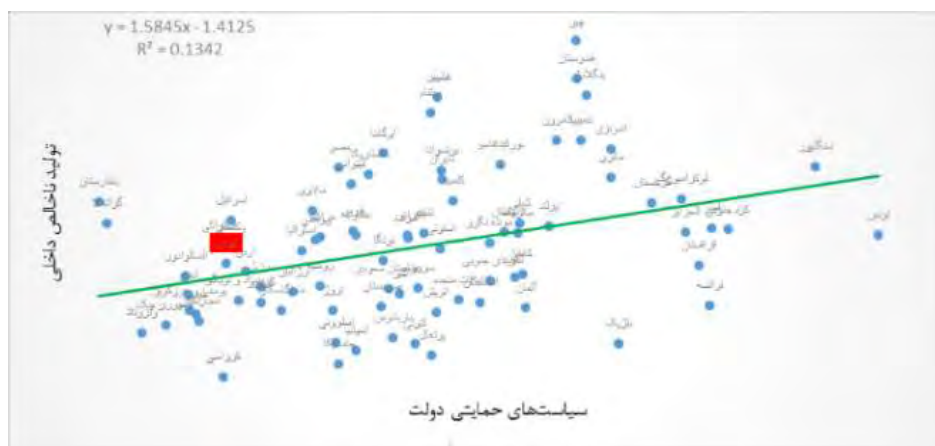
شکل ۲- رابطه‌ی سیاست‌های حمایتی دولت و تولید ناخالص داخلی

کسب‌وکار را افزایش دهد. سوم از طریق فعالیت‌های لازم برای بهبود برداشت جامعه نسبت به بخش کارآفرینی، محیط هنجاری خود را تقویت کرده‌اند که این امر می‌تواند انگیزه‌ی افراد را برای تبدیل‌شدن به کارآفرین بهبود دهد (فورفاس، ۲۰۰۹).