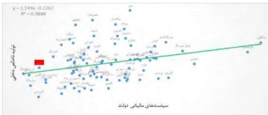
شکل ۳- تأثیر سیاست‌های مالیاتی دولت بر تولید ناخالص داخلی

در شکل (۳) سیاست‌های مالیاتی دولت دارای رابطه‌ی مثبت با تولید ناخالص داخلی می‌باشد. بدین مفهوم که کشورهایی که سیاست‌های مالیاتی کارآمدتری داشته‌اند رشد اقتصادی بهتری را نیز تجربه کرده‌اند. با این حال کشور ایران دارای شرایط مطلوبی نمی‌باشد.