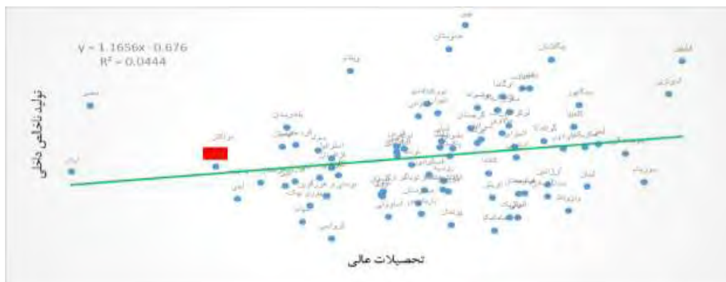
شکل ۶- تأثیر تحصیلات عالی بر تولید ناخالص داخلی

در شکل (۶) تحصیلات عالی دارای رابطه‌ی مثبت با تولید ناخالص داخلی می‌باشد. این بدان معنی است که کشورهایی که تحصیلات عالی کارآمدتری داشته‌اند رشد اقتصادی بهتری را نیز تجربه کرده‌اند. کشورهای فیلیپین و اندونزی تحصیلات عالی مناسب‌تر و رشد اقتصادی بیشتر را داشته‌اند.