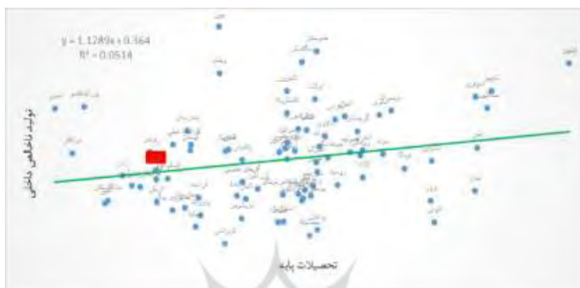
شکل ۵- تأثیر تحصیلات پایه بر تولید ناخالص داخلی

آموزش، با فراهم آوردن مهارت‌های کاربردی برای شروع کسب‌وکار، (کلاریس و برونیل، ۲۰۰۷) از طریق بهبود توانایی درک و تشخیص فرصت‌های کارآفرینی و از طریق تشویق فعالیتهای ریسکی به‌عنوان یک گزینه شغلی، موجب افزایش تعداد کارآفرینان میشود (کیوشنیگ و سورن، ۲۰۰۴). تحقیقات پیشین نشان میدهند که رابطه مثبت بین آموزش کارآفرینی و یا برنامه‌های کارآفرینی در دانشگاه‌ها و درک جذابیت و امکان‌پذیر بودن کارآفرینی وجود دارد (بلائو، ۱۹۸۷). انتظار بر این است کشورهایایی که برنامه‌های آموزشی قوی‌تری برای حمایت از کارآفرینی دارند میزان بالاتری از مشارکت کارآفرینان را شاهد باشند.