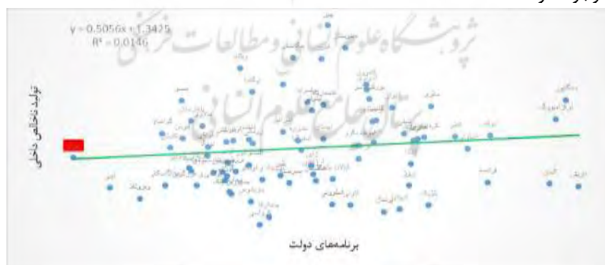
شکل ۴- تأثیر برنامه‌های دولت بر تولید ناخالص داخلی

برنامه‌های دولتی یا خدمات حرفه‌ای (به‌عنوان مثال حسابداران، بانکداران، وکلا و / یا مشاوران کسب‌وکار) که ارائه‌دهنده خدمات و کمک هستند، می‌توانند ظرفیت‌های کارآفرینی را در میان اقتصادها افزایش دهند (میتال و ویاس، ۲۰۱۱). دولت می‌تواند کارآفرینان را با برنامه‌های آموزش کسب‌وکار که یارانه‌ها، مواد و مشاوره را برای شرکت‌های جدید که توسط اتاق‌های بازرگانی یا از طریق انکوباتورهای تحت حمایت عمومی حمایت کند (بارتیک، ۱۹۸۹)، چنین برنامه‌هایی هزینه‌های معامله را برای سازمان‌ها به حداقل می‌رساند؛ درحالی‌که سرمایه انسانی مؤسسات را افزایش می‌دهد (بلاثو، ۱۹۸۷). چنین برنامه‌هایی هزینه‌های معامله برای سازمان‌ها را کاهش می‌دهد و سرمایه انسانی مؤسسات را افزایش می‌دهد (بلاثو، ۱۹۸۷). برنامه‌های دولتی با اصلاح شکست بازار، آن را هدایت می‌کنند. هنگامی که محیطی قوی برای حمایت از کارآفرینی وجود دارد، سطح بالاتری از کارآفرینی وجود خواهد داشت.