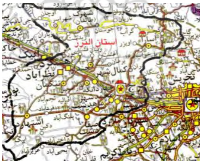
شکل (۱) روستاهای تحت نفوذ و همجوار با شهرک صنعتی سپهر

شیوه نمونه گیری براساس روش تصادفی است، و نمونه ها بطور تصادفی از روستاهای تحت نفوذ و همجوار با شهرک صنعتی سپهر که شامل : نجم آباد، خرم آباد، شاه بداغ ، شیخ حسن، فتح آباد، قبقاق، قزل حصار، قشلاق محمدلو، محمد آباد افخم الدوله، میلک سرکار، وایه بک، گل دره، قوچ حصار، مزرعه عزیز آباد، مزرعه اژدری، ازبکی، زمان آباد، مهدی آباد، ابراهیم جیل، تنکمان، بختیار، حسین آباد، قارپوزآباد، رضا آباد، خانی بیک، باقرآباد فاضل، مغرور آباد، میمون آباد، مسکین آباد، احمد آباد ، همت آباد، کاظم آبا ، دنگیزک، حسن مجدالدوله، قلعه شیخ، حسن بکول، صفر خواجه کله بهرام، گازرسنگ می باشد انتخاب شدند. وضعیت ناحیه مورد مطالعه به ترتیب در شکل شماره ۱ نشان داده شده است.