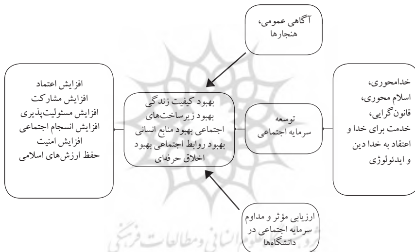
نمودار شماره (۲): الگوی کدگذاری توسعه سرمایه اجتماعی در دانشگاه‌ها

بنابراین، الگوی کدگذاری توسعه سرمایه اجتماعی در دانشگاه‌ها در نمودار زیر نشان داده شده است: