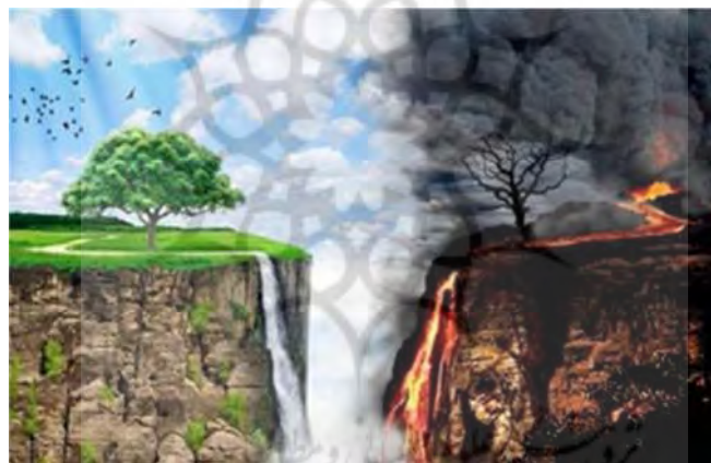
تصویر ۷: نورپردازی متفاوت بهشت و جهنم در دو صحنه مشابه

بنابراین از آنچه در خصوص صحنه‌های بهشت و جهنم گفته شد برمی‌آید که نورپردازی در صحنه‌های جهنم تلفیقی از نورهای؛ زرد، قرمز و نارنجی برخاسته از آتش و رنگ سیاه یا خاکستری تیره حاصل از دود آتش است و طبیعی است که صحنه‌ای با چنین نورپردازی سبب هول و وحشت و ایجاد رعب در انسان می‌شود در حالی که صحنه‌های بهشت تلفیقی از رنگ خاکستری روشن و شفاف و انعکاس نور در رنگ‌هایی چون سفید و سبز و آبی است که همه از رنگ‌های شاد هستند و انسان به سبب آنها نوعی امنیت و آرامش را در نهاد خود احساس می‌کند. کنار هم گذاری دو صحنه مشابه با نورپردازی‌های متفاوتی که در صحنه‌های مربوط به بهشت و جهنم خواندیم، گویای همین مطلب است: (تصویر شماره ۷)