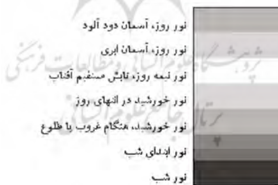
تصویر ۲: طیف نور در طول روز و شرایط جوی

اما راجع به اینکه چرا قرآن کریم در مورد صحنه‌های بهشت از منبع نور خورشید مستقیماً بهره نگرفته است و واژه "ظل" یا "سایه" را به میان آورده است. در نورپردازی سینما و عکاسی پس‌زمینه‌هایی با رنگ خاکستری بی‌دردسرتین پس‌زمینه‌ها هستند زیرا کمترین مشکلات نورپردازی را ایجاد می‌کنند. اما پس‌زمینه‌های سیاه یا سفید می‌توانند باعث بروز مشکلات نوردهی شوند و در پس‌زمینه‌های رنگی نیز باید در انتخاب آنها دقت شود تا ترکیب رنگی سوژه با آنها تقویت شود نه تخریب (موسوی، ۱۳۹۳: ۳۲). در تصویر شماره ۲، طیف نور در طول روز و شرایط جوی به نمایش گذاشته شده است: