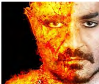
تصویر ۶: تجسم چهره سوخته جهنمیان