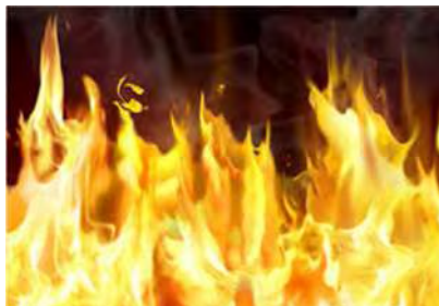
تصویر ۵: نمایه آتش و دود حاصل از آن

همانطور که می‌دانیم و در تصویر ۵ پیداست، از آتش دودی تیره و تار برمی‌آید که فضای بالای آتش را تاریک و دودآلود می‌کند. در اینجا رابطه‌ی تقابلی نور و سایه، جملگی به صورت یک واحد انرژی نورانی در یک جا متمرکز می‌شوند که آن نور به نوبه‌ی خود مجموعه‌ای ترکیبی از همه‌ی آنها خواهد بود. لذا پروردگار متعال برای نورپردازی صحنه‌های هولناک جهنم از شعله‌های آتش و دود سیاه برخاسته از آن استفاده می‌کند. در عرصه‌ی سینما به ندرت فیلمبرداری پیدا می‌شود که نسبت به فهم و ادراک بصری بیننده از محتوای فیلمنامه به چنین ادراک والایی دست یافته باشد. این چنین نمایش صحنه دلیل بر قاطعیت و حتمیت وقوع آن است که اینگونه به وضوح خواننده را به احاطه‌ی عمیق و دقیق و آگاهانه از موضوع می‌رساند.