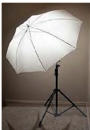
تصویر ۱: چتر مخصوص نورپردازی

ملایم، با کتراست کم، نرم و یکنواخت از چترهای مخصوص نورپردازی استفاده می‌کنیم» (موسوی، ۱۳۹۳: ۲۱).