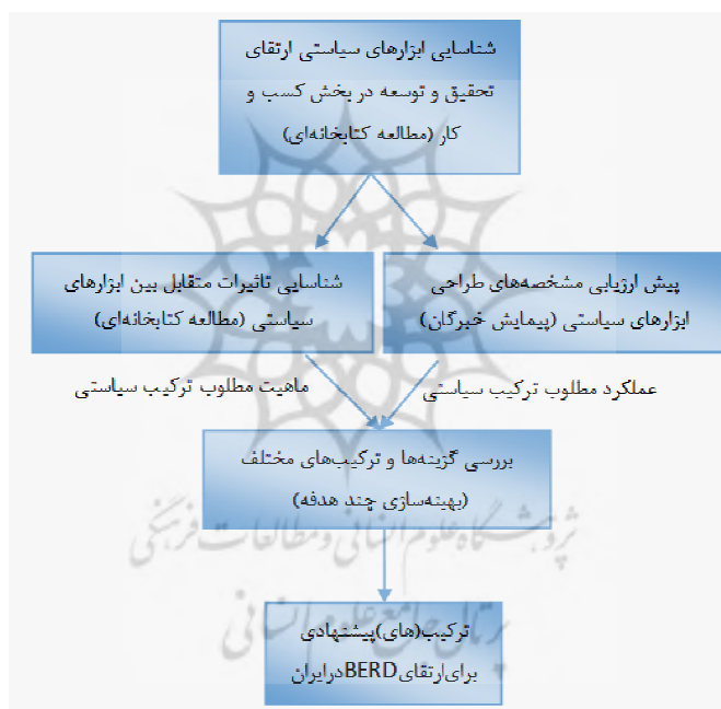
شکل ۱) مراحل طراحی ترکیب ابزارهای سیاستی برای افزایش هزینه‌کرد بخش کسب‌وکار ایران در فعالیتهای تحقیق و توسعه

این تحقیق با هدف طراحی ترکیبی از ابزارهای سیاستی برای ارتقاء هزینه‌کرد بخش کسب‌وکار کشور در فعالیتهای تحقیق و توسعه انجام شده که با توجه به مدل پیاز پژوهش [۶] پارادایم حاکم بر آن پارادایم اثبات‌گرایی است. به لحاظ نوع، یک تحقیق کاربردی است که در آن راه‌حلی کاربردی برای یک مسئله منحصر به فرد جستجو می‌شود. بدین منظور از رویکرد استقرایی و راهبردهای مختلف (مطالعات کتابخانه‌ای و میدانی) به فراخور مراحل تحقیق استفاده شده است. روش تحقیق، مشتمل بر روش‌های کمی و کیفی، بازه زمانی آن، تک‌مقطعی و ابزارهای گردآوری داده‌های آن هم شامل اسناد و مدارک به علاوه پرسشنامه بوده است. مراحل طراحی ترکیب ابزارهای سیاستی برای افزایش هزینه‌کرد بخش کسب‌وکار ایران در فعالیتهای تحقیق و توسعه به صورت شکل ۱ ارائه گردیده است.