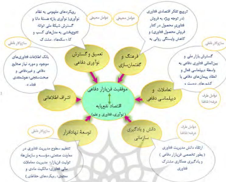
شکل ۴- مدل نهایی تحقیق از منظر راهبردهای اساسی موفقیت فن‌بازار (محقق ساخته)