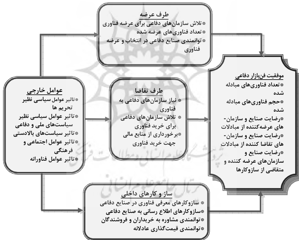
شکل ۲- مدل نهایی پژوهش از منظر شاخص‌ها و عوامل سنجش (محقق ساخته)

با توجه به موارد فوق و بر اساس نتایج این تحقیق می‌توان گفت که اولاً، فن بازارهای دفاعی به یقین تاکنون با عدم موفقیت روبرو بوده‌اند و ثانیاً برای تضمین موفقیت فن بازارهای دفاعی باید در وهله اول به اتخاذ سیاست‌هایی برای تحریک طرف عرضه و بهبود سازوکارهای داخلی فن بازار اقدام نمود و در وهله بعد به عوامل خارجی یا محیطی مخصوصاً مباحث سیاسی، فناورانه و همچنین اقتصادی توجه کرد و چاره‌ای برای کاهش تهدیدها و استفاده از فرصت‌های جدید سیاسی و اقتصادی اندیشید. بر اساس نتایج این تحقیق، تحریک بنگاه‌های طرف تقاضا برای استفاده از فن بازار، اولویت نهایی اقدام در این زمینه است مهم‌ترین اقدام بخش تقاضا تحریک نیاز در مشتریان است که خود نیازمند برگزاری نمایشگاه‌های مختلف یا تبلیغات با رعایت طبقه‌بندی‌ها است. ساز و کارهای داخلی هم مانند سیاست‌گذاری در بخش نمایش فناوری و یا اطلاع‌رسانی و اطلاع‌رسانی نیز می‌تواند در ایجاد موفقیت در فن بازار دفاعی، مهم و تاثیرگذار باشند.