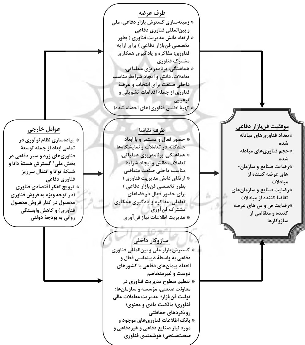
شکل ۳- مدل نهایی تحقیق با تکیه بر سازوکارهای پیشنهادی تحقیق (محقق ساخته)

انتخاب برای رشد و توسعه از ویژگیهای لازم برای فروش برخوردار بوده باشد به بیانی دیگر سازمان‌های طرف عرضه به سمت تولید فناوری‌هایی بروند که جزء نیازهای اساسی مشتریان بوده و اقتصادی باشد. همچنین به شایستگی بتوانند زمینه معرفی ویژگیها و جذابیت‌های پایه فناوری را برای طرف تقاضا فراهم آورند در شکل ۲، مدل نهایی تحقیق (از منظر شاخص‌ها و عوامل سنجش)، ارائه شده است. در شکل ۳، مدل نهایی پژوهش با تکیه بر سازوکارهای پیشنهادی مؤثر بر عوامل اصلی موفقیت فن بازار برگرفته از تلفیق تحلیل محتوای مصاحبه با خبرگان و نتایج تحلیل عاملی تاییدی نشان داده شده است.