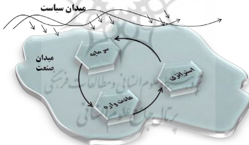
شکل ۲- طرح نظری پژوهش

ارتباط بین عادت‌واره و میدان پویا و ناتمام است. این دو کاملاً بر هم منطبق نمی‌شوند زیرا هر یک منطق درونی و تاریخی خاص خود را دارند. گسست میدان و عادت‌واره که بورديو از آن به ناسازی تعبیر می‌کند، مهم‌ترین سازوکار تغییر است. تغییر در یکی ضرورتاً به تغییر در دیگری منجر می‌شود [۲۶]. در شرایط ثبات عادت‌واره و میدان با هم سازگاری دارند. اما عادت‌واره مدام در واکنش به تجربیات جدید تغییر می‌کند. مداخلات میدان سیاست و دستکاری‌هایی که نسبت به سرمایه‌های درون میدان می‌کند شرایط ناسازی، گسست و تحول را به وجود می‌آورد. ورود کنش‌گران جدید به میدان، تغییرات فناورانه از دیگر عوامل تأثیرگذار بر ناسازی است.