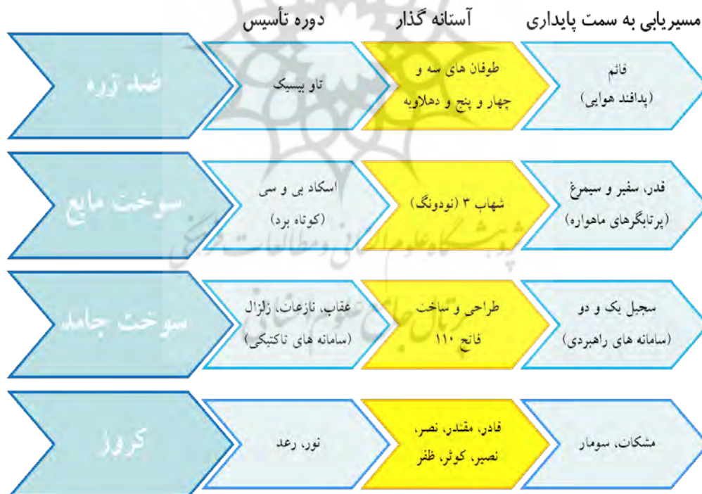
شکل ۳- روند تغییرات تکنیکی در مسیرهای مختلف صنعت موشکی ج.ا.ا.

در دوره تأسیس، یک ظرفیت صنعتی برای دستیابی به یک خانواده‌ی محصولی خاص شکل می‌گیرد. پس از ظهور یک ظرفیت صنعتی، با تعریف پروژه‌های جدید و پیچیده‌تر، صنعت در آستانه تحول قرار گرفته و پس از عبور از این آستانه وارد دوران اولیه بلوغ می‌شود. دوره بلوغ، دوره مواجهه با چالش ناپایداری و چاره‌اندیشی برای آن است. به همین خاطر، از آن به دوره مسیریابی به سمت پایداری یاد می‌شود. در دوره بلوغ، در تعریف و شکل‌دهی به پروژه‌های نوآوری، علاوه بر جنبه‌های نوآورانه، ملاحظات مربوط به پایداری صنعت نیز مورد توجه قرار می‌گیرد. دوره بلوغ، دوره‌ای است که پایداری نسبی در وضعیت میدان دیده می‌شود (پایداری با ثبات تفاوت دارد. به عبارتی، در پایداری نوعی تعادل پویا وجود دارد). در واقع در مرحله سوم، نزاع بین هم‌پایی ۱ و پایداری، به نوعی همراهی تبدیل می‌شود. موضوع اصلی، میدان است.