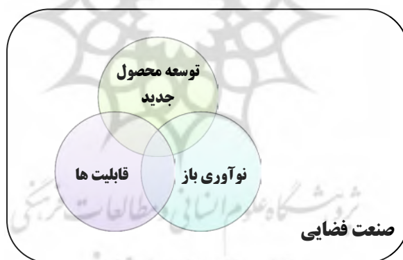
شکل ۲- محدوده نظری پژوهش

قلمرو موضوعی این مطالعه، از سه عنصر اصلی توسعه محصول جدید، نوآوری باز و قابلیت‌های مدیریت طرح تشکیل می‌شود و قلمرو مکانی شامل صنعت فضایی، صنایع وابسته، پیمان‌کاران و نهادهای وابسته به صنعت فضایی در سال ۱۳۹۲، است.