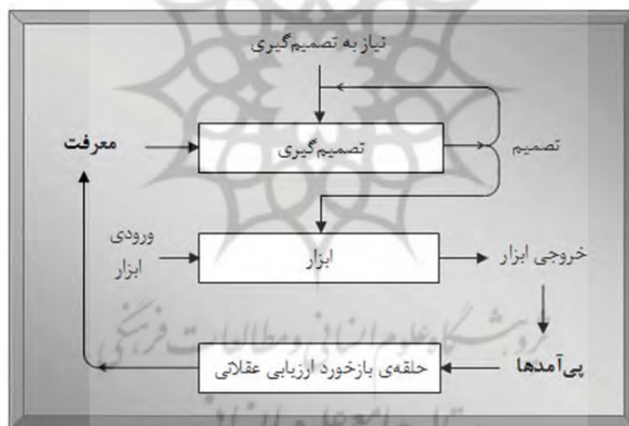
شکل ۲- نموداری از چگونگی عملکرد الگوی پیت

اعتقاد پیت، تمامی ابزارها، اعم از فیزیکی و اجتماعی، چیزی را به چیز دیگری تبدیل می کنند و می توان آن ها را نوعی تبدیل در نظر گرفت. بدین ترتیب عنصر دوم الگو، که خود ابزار است، همواره در ذیل عنصر اول، یعنی تبدیل تصمیم گیری، مورد استفاده قرار می گیرد. پیت تصریح می کند که دو عنصر پیش گفته، در کنار هم، برای ارائه الگوی شایسته از فناوری کافی نیست و نیاز به عنصر سوم وجود دارد. عنصر سوم الگوی پیت، سازوکار بازخورد ارزیاب ۱ است. هدف از فناوری، رسیدن به موفقیت است و موفقیت با توجه به اینکه معرفت ورودی به تبدیل تصمیم گیری ممکن است دچار نقص و عیب باشد تضمین نمی شود. تنها راه معطوف بودن فناوری به موفقیت، بهره گیری از اصل عرفی عقلانیت ۲ یعنی درس آموزی از تجربه است. بنابراین لازم است سازوکاری به دو عنصر قبلی، به عنوان عنصر سوم الگو، اضافه شود که طبق آن پیامدهای تبدیل تصمیم گیری و به کارگیری ابزار بررسی و با اهداف مقایسه شده و در نهایت، معرفت کسب شده از تجربه به ورودی تبدیل تصمیم گیری منتقل می گردد. به این ترتیب، گرچه موفقیت تضمین نمی شود، ولی راه رسیدن به آن، با اصل عرفی عقلانیت به تدریج کشف شده و هموار می گردد ۳ [۱۳].