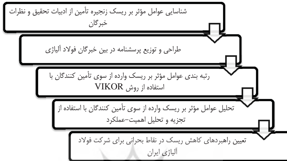
شکل ۱- چارچوب اجرایی تحقیق

راه کارهای تصمیم‌گیری چند معیاره روش‌هایی هستند که با استفاده از معیارهای کمی و کیفی چندگانه به رتبه‌بندی گزینه‌های تصمیم‌گیری می‌پردازند و تصمیم‌گیرندگان را در انتخاب یاری می‌کنند. روش‌های متعددی برای تصمیم‌گیری با چندین معیار ارائه شده است [۵۲]. در این تحقیق از راه کار VIKOR، به منظور رتبه‌بندی عوامل مؤثر بر خطر پذیری‌های وارده از سوی تأمین کنندگان، استفاده شده که در ادامه به توضیح آن پرداخته می‌شود.