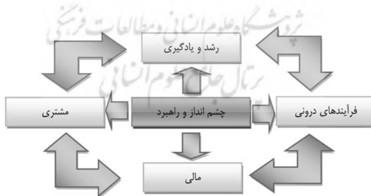
شکل ۱- مناظر کارت امتیازی متوازن (کاپلان و نورتون، ۱۹۹۶)

دلیل انتخاب نام امتیازات متوازن این است که این الگو در برگیرنده مجموعه ای از مقیاس هاست و یک تعادل و توازن بین اهداف بلند مدت و کوتاه مدت و بین مقیاس های مالی و غیرمالی، بین شاخص های رهبر و زیردست و بین چشم اندازهای عملکرد داخلی و خارجی برقرار می کند [۲۲]. بنابر نظر برخی از محققان، کارت امتیازی متوازن یک رویکرد نظام یافته مدیریت عملکرد راهبردی است که سازمان ها را در تبدیل اهداف راهبردی به سنجه های عملکردی مرتبط با آن ها یاری می دهد [۸]. همان طور که از شکل ۱ پیداست کارت امتیازی متوازن، چهار بعد را برای ارزیابی عملکرد معرفی می کند [۱۳]: