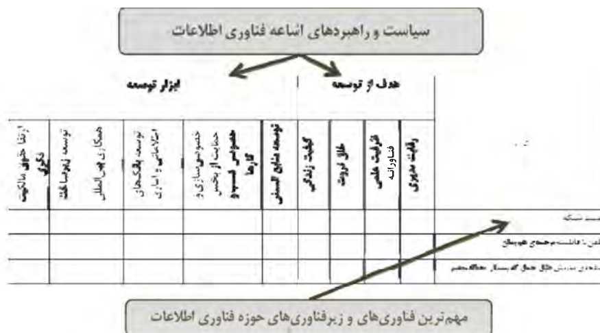
شکل ۲- چارچوب شماتیک بخش سوم پرسش ها

بر اساس این چارچوب لازم است تا دو ورودی اولیه به منظور طراحی پرسش نامه مورد استفاده قرار گیرد که عبارتند از: