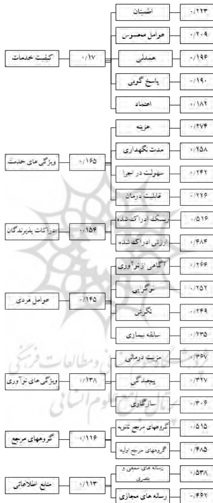
شکل شماره ۱. اولویت ابعاد و مؤلفه ها

در نهایت با استفاده از میانگین نظرهای اصلاحی جدید و نرمالیزه کردن آنها به تعیین اولویت عوامل پرداخته شد. در شکل ۱ میزان اولویت ابعاد و مؤلفه ها به همراه درصد اهمیت هر گروه نشان داده شده است شایان ذکر است به دلیل تعداد بالای شاخص‌ها، اولویت آنها در شکل نمایش داده نشده است.