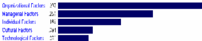
شکل شماره 3- نتایج تحلیل سلسله مراتبی

ضرایب به دست آمده نشان می‌دهد که بُعد "عوامل سازمانی" با ضریب 0,397 در اولویت اول قرار دارد. بعد از آن، به ترتیب ابعاد "عوامل مدیریتی" با ضریب 0,259، "عوامل فردی" با ضریب 0,169، "عوامل فرهنگی" با ضریب 0,094 و "عوامل فناورانه" با ضریب 0,082 در رتبه‌های دوم تا پنجم قرار دارند.