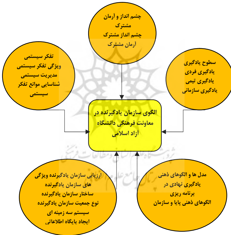
شکل شماره (2)- مدل حاصل از تحلیل محتوای کیفی

متغیر های مورد بررسی در این تحقیق عبارتند از: متغیر مستقل: سطوح یادگیری، تفکر سیستمی، چشم انداز و آرمان مشترک، مدل ها و الگوهای ذهنی و ارزیابی سازمان یادگیرنده متغیر وابسته: الگوی سازمان یادگیرنده در معاونت فرهنگی دانشگاه آزاد اسلامی