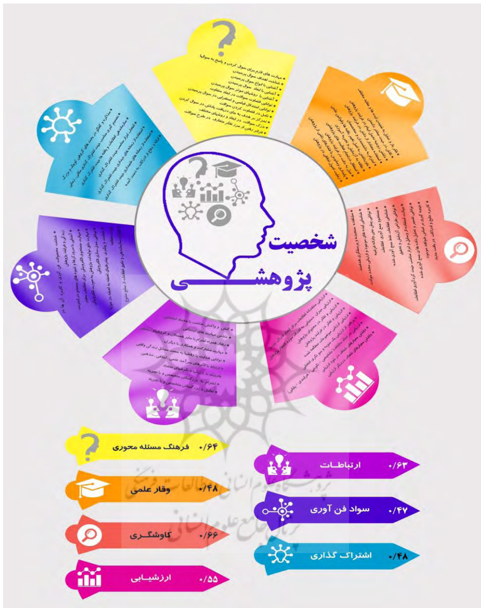
شکل ۳: مدل نهایی به دست آمده به انضمام ضرایب مسیر در شکل ۳ نشان داده است.