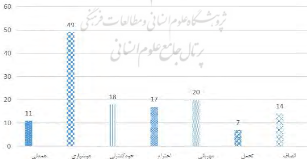
شکل ۱- فراوانی مولفه های هوش اخلاقی در کتاب فارسی پنجم