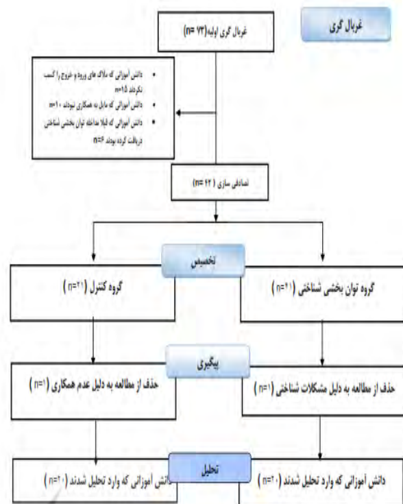
شکل ۱. نمودار کنسپت (Concept) روند فرآیند شرکت کنندگان در جریان مطالعه توان بخشی شناختی

مقیاس درجه‌بندی رفتاری کارکردهای اجرایی ۴ (BRIEF): این مقیاس توسط جیویا ۵ و همکاران (۲۰۰۰) در دو فرم والدین و معلمان به منظور سنجش کارکردهای اجرایی کودکان و نوجوانان ۵ تا ۱۸ سال در محیط خانه و مدرسه طراحی شده است. در پژوهش حاضر از فرم والدین این مقیاس استفاده شد، که دارای