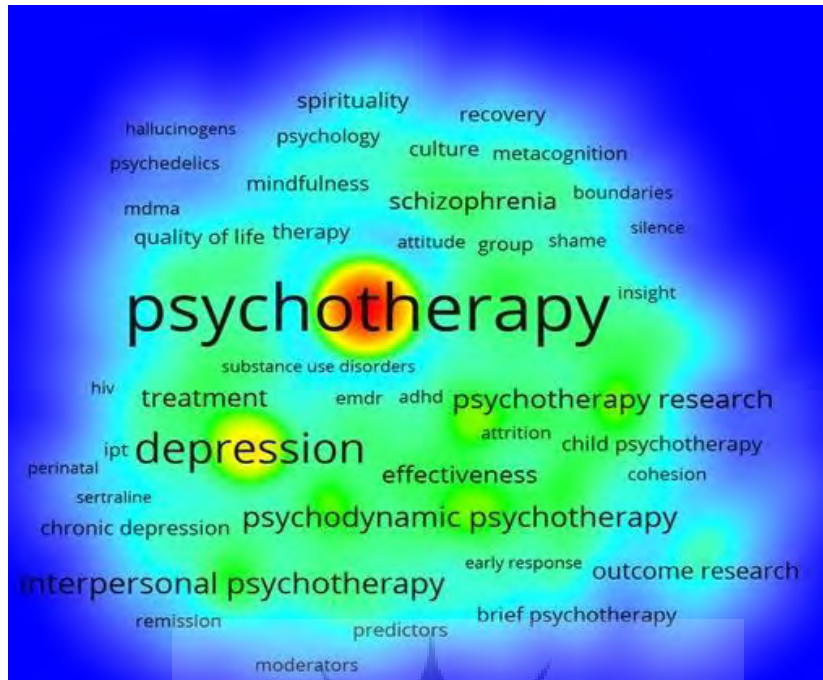
شکل (۱) نقشه چگالی و خوشه‌های تشکیل شده در شبکه هم‌رخدادی واژگان در روان‌درمانی

از سوی دیگر تحلیل خوشه‌های شبکه هم‌رخدادی واژگان در حوزه روان‌درمانی ۱۱۵۰۶ واژه را از طریق نرم‌افزار شناسایی کرد که از این تعداد ۵۰۰ واژه پرتکرار در نقشه وارد شده و ۷ خوشه اصلی واژگان را تشکیل دادند. خوشه اول (رنگ قرمز) از ۱۳۶ واژه، خوشه دوم (رنگ سبز) از ۱۲۲ واژه، خوشه سوم (رنگ آبی) از ۹۲ واژه، خوشه چهارم (رنگ زرد) از ۵۵ واژه، خوشه پنجم (رنگ صورتی) از ۴۱ واژه، خوشه ششم (رنگ بنفش) از ۳۵ واژه و خوشه هفتم (رنگ فیروزه‌ای) از ۱۹ واژه تشکیل شده است. به دلیل حضور واژه Psychotherapy در خوشه اول، این شبکه از بیشترین پیوند برخوردار است و واژه Psychotherapy در ۱۷۱۶ مدرک تکرار شده که بیشترین بسامد را به خود اختصاص داده است و همچنین از ۳۴۷۰ پیوند برخوردار است که دارای بیشترین قدرت پیوند در بین سایر واژه‌ها است. در خوشه دوم واژه Depression در ۴۷۳ مدرک ذکر شده و از ۱۲۸۵ پیوند برخوردار است. عبارت دیگر در این خوشه Interpersonal psychotherapy است که با حضور در ۱۵۲ مقاله ۴۰۱ قدرت پیوند را به خود اختصاص داده است. همچنین واژه پرتکرار دیگر در این خوشه Meta-analysis است که با حضور در ۱۴۳ مقاله ۴۱۳ قدرت پیوند را به خود اختصاص داده است. در خوشه سوم Group psychotherapy با حضور در ۱۷۳ مدرک ۳۰۹ قدرت پیوند دارد و در رتبه سوم قرار گرفته است. واژه بعدی در خوشه سوم Psychodynamic psychotherapy است که با حضور در ۱۳۶ مقاله ۲۷۲ قدرت پیوند را به خود اختصاص داده است. در خوشه چهارم Psychotherapy research با حضور در ۱۲۵ مقاله ۱۷۵ قدرت پیوند را به خود اختصاص داده است.