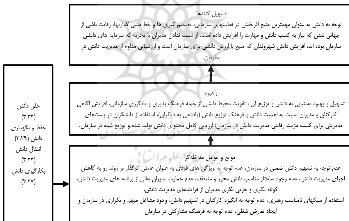
شکل ۲. مدل نهایی مدیریت دانش

لذا این شاخص نیز از وضعیت قابل قبول و برازش مناسبی برخوردار است. مقدار قابل قبول معیارهای نیکویی برازش و حد تعدیل شده آن (GFI AGFI &)، معیار برازش هنجار شده