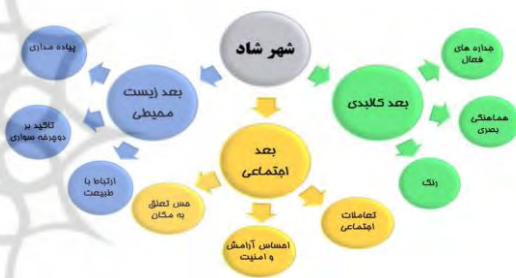
تصویر ۲- مولفه های تاثیرگذار بر شهر شاد

مناسب و هماهنگ، ایجاد فضایی برای گفت و گو، مانند فضاهای نشسته با مبلمان انعطاف‌پذیر، استفاده از کاربری‌های فعال که سبب جذب افراد متفاوت گردد، تقویت ابعاد اجتماعی برای جذب افراد و برقراری ارتباط اجتماعی بین آنها بیشتر از طریق کافه‌ها و رستوران‌های روباز، صندلی و نیمکت، فضاهای برای تفریح و اوقات فراغت، فعالیت‌های سرگرمی مانند بازی‌های گروهی برای همه سنین، کنسرت، موسیقی سنتی و تئاتر و همچنین توجه به پیاده مداری و دوچرخه سواری به عنوان معیارهایی برای شهر شاد محسوب می‌شود که در تصویر زیر با توجه به ابعاد فضاهای شهری شامل بعد کالبدی، اجتماعی و زیست محیطی هر کدام از معیارها با کارشناسان رشته شهرسازی دسته بندی شده است.