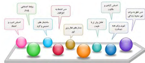
تصویر ۱- عوامل موثر بر شادی از دید مونتگومری (مونتگومری به نقل از شاد، ۱۳۹۵، ۵۱)

زندگی ما معنی می‌دهند را ساخته و تقویت نمایید (Montgomery, 2013).