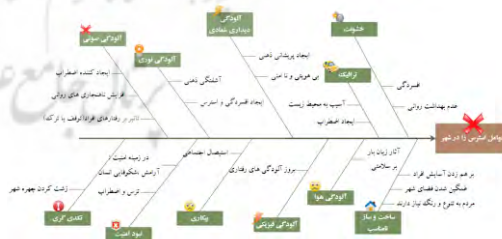
تصویر ۳- عوامل ایجاد کننده استرس در شهر (صفری نیا و دیگران، ۱۳۹۴)

امروزه شهرنشینی فزاینده مشکلات متفاوت زیادی را برای کشورهای در حال توسعه ایجاد کرده است و توجه به مفهوم امنیت شهروندان و روش‌های ارتقا آن به عنوان یکی از الویت‌های اساسی تبدیل شده است. مردم در فضاهایی چون کوچه‌های تاریک و خلوت، خیابان‌ها و فضاهای خلوت و کم تردد شهر، مسیریایی که از لحاظ کالبدی دچار مشکل هستند (خرابه‌ها و ویرانه‌ها) و مکان‌هایی که موجب سلب آسایش و امنیت شهروندان می‌شود، قسمت‌هایی کنج و دنج فضاهای عمومی، قسمت‌هایی که آلودگی‌های محیطی و کم‌نوری وجود دارد احساس امنیت کمتری دارند. چنین عواملی موجب کاهش حضور افراد و معضلات و پیامدهایی از قبیل عدم اعتماد، احساس نگرانی، استرس و دوری جستن از محیط و عدم حفظ مدنیت را به دنبال دارد. این عوامل از مهمترین عوامل در عدم نشاط افراد محسوب می‌شود و می‌توان گفت امنیت و عدم استرس یکی دیگر از معیارهای موثر در نشاط فضاهای شهری محسوب می‌شود.