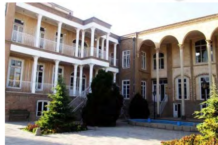
شکل ۱۳- خانه گنجه ای زاده

این خانه تلفیقی است از معماری دوره قاجار و معماری دوره پهلوی اول در محله تاریخی مقصودیه، روبروی دانشکده معماری واقع شده است. این اثر در ۸ مرداد ۱۳۸۱ با شماره ثبتی ۶۰۲۱ به عنوان آثار ملی ایران ثبت شده است. خانه ۴۰۰۰ مترمربع و در زیربنایی ۷۳۰ مترمربعی ساخته شده است. خانه گنجه ای زاده از نظر دوره شناسی به دو دوره تاریخی تقسیم می گردد و مطالعات میدانی و ثبتی بنا نشان می دهد که کالبد کهن این خانه بخش شرقی آن است که مربوط به اوایل دوره قاجار بوده و کالبد الحاقی جانب غربی آن متعلق به اوایل دوره پهلوی است. قسمت شرقی به شکل درو نگرا و بخش غربی برو نگرا است. آجر مصالح اصلی نما است و از عناصر معماری نئوکلاسیک مانند سنتوری و سرستون های کرتین در جبهه غربی استفاده شده است (سلطان زاده و همکاران، ۱۳۹۸).