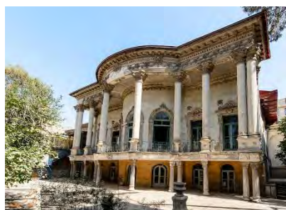
شکل ۶- خانه مستوفی الممالک