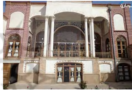
شکل ۱۰- خانه حیدرزاده