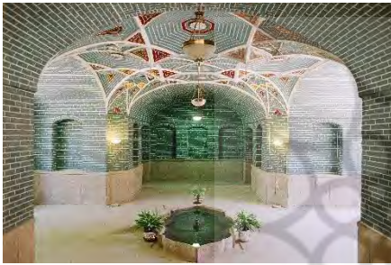
شکل ۱۱- خانه حیدرزاده