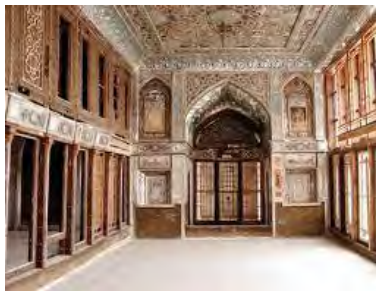
شکل ۵- خانه امام جمعه

این بنای تاریخی در خیابان ناصر خسرو، کوچه امام جمعه شماره ۳۷ قرار گرفته است. قدمت این بنا به دوره قاجاریه و به ۱۲۸۰ ه.ق می‌رسد و در تاریخ ۷۵/۸/۲۶ به ماده ۱۷۷۲ در فهرست آثار ملی ثبت گردید (میراث فرهنگی تهران، ۱۳۸۸). این بنا دارای بخش اندرونی و بیرونی است. طبقه اول شمال بخشهای، تالار تابستانی، حوض خانه، توالی و دستشویی، ایوان شمالی جنوبی و پله‌های دسترسی به طبقه دوم، دو اتاق گوشواره و یک پستو یا انباری، گوشواره‌ها که در دو طرف حوض خانه با آجر مفروش شده است. طبقه دوم دارای ایوان، تالار تابستانی، تالار زمستانی و اتاقهای خصوصی میباشد. ایوان ستوندار با سر ستونهای گچبری و مقرن، دارای کف آجری میباشد. معماری ستونها در کلیه دوره‌های یاد شد در غرب بر قواعد (تناسبها) تقارن و تکراری معین استوار بود (آرشیو میراث فرهنگی تهران، ۱۳۸۸).