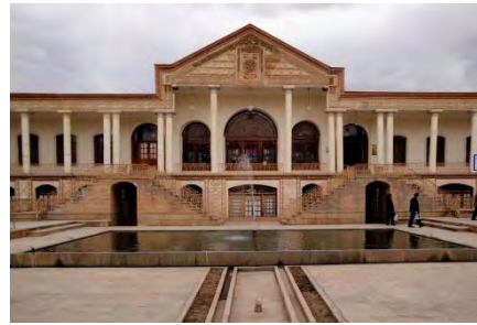
شکل ۸ - خانه امیرنظام گروسی