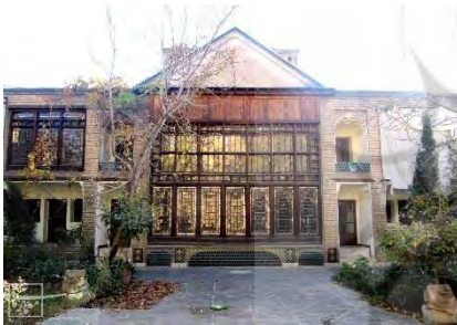
شکل ۳- خانه وثوق الدوله