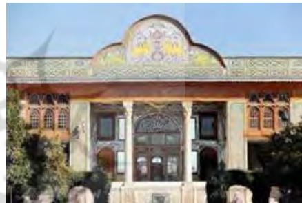
شکل ۲- خانه وثوق الدوله