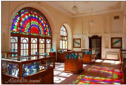
شکل ۹- خانه امیرنظام گروسی