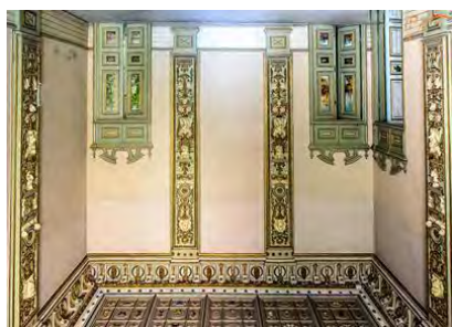
شکل ۷- خانه مستوفی الممالک

خانه مستوفی الممالک یکی از دست نخورده ترین خانه‌های تاریخی تهران است که در محله تاریخی سنگلج تهران واقع شده است. خانه مستوفی در دوره ناصری در سال ۳۰۱۱ ه ق (هزار و دویست و هفتاد و دو هجری شمسی) ساخته شده است. ورودی اصلی ساختمان در ضلع شمال شرقی مجموعه قرار داشته که دارای درب دو لنگه چوبی بزرگ و سر در قوس دار است و میدانی بزرگ هم در جلوی آن قرار داشته است. در قسمت ایوان‌ها در ایوان جنوبی در سطح زیرزمین از ستون های سنگی استفاده شده و در طبقه اول از ستون های چوبی اندود شده است (آرشیو میراث فرهنگی تهران، ۱۳۸۸).