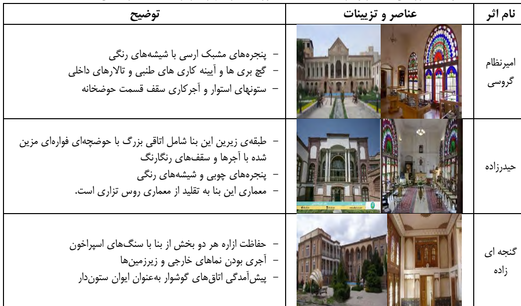
جدول ۳. بررسی عناصر و تزئینات خانه‌های دوره قاجار شهر تبریز (ماخذ: نگارندگان، ۱۳۹۹)