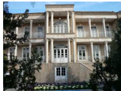
شکل ۱۲- خانه گنجه ای زاده