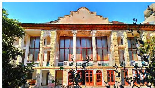
شکل ۴- خانه امام جمعه