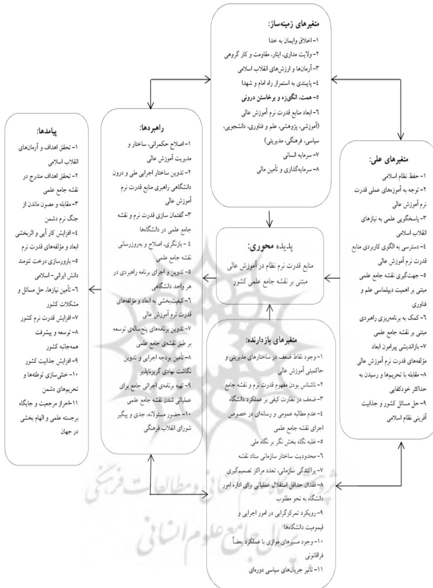
شکل ۳. الگوی پارادایمیک منابع قدرت نرم جمهوری اسلامی ایران در آموزش عالی مبتنی بر نقشه جامع علمی