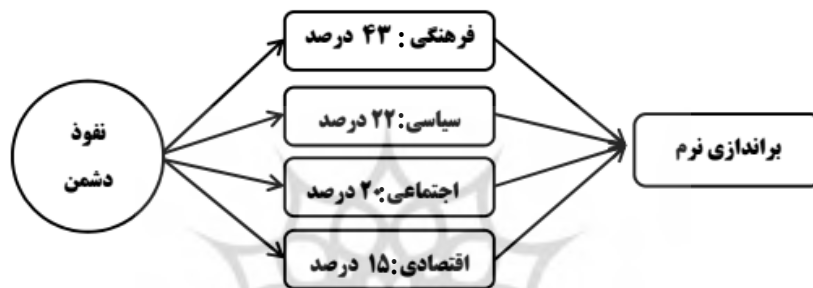
شکل ۲. عرصه‌های نفوذ به ترتیب اولویت

شکل (۲) گونه‌های نفوذ را براساس اهمیت و درصد اولویت آن از منظر رهبر معظم انقلاب به تصویر کشیده است. براساس بیانات معظم‌له از بین عرصه چهارگانه نفوذ، عرصه فرهنگی بدلیل تأثیر بر سایر عرصه‌ها از اهمیت و جایگاه مهمی برخوردار است. چون دارای لایه‌هایی پیچیده‌ای است که نیاز به هشیاری و ظرافت خاصی دارد.