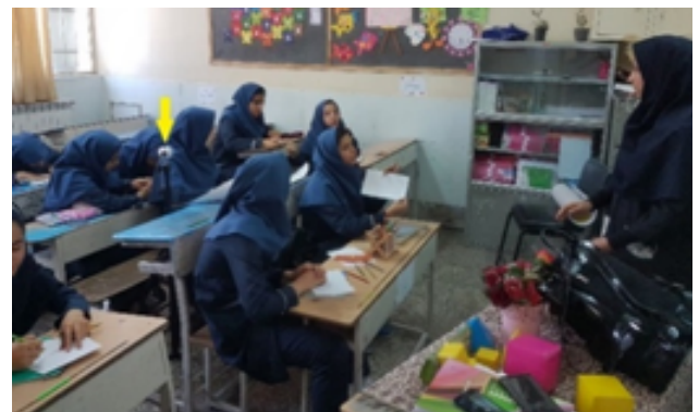
شکل ۱. الف) نمونه‌ای از ضبط یک سناریو در کلاس (به جایگاه دوربین دقت کنید). ب) نمونه تصویر مشاهده شده روی هدست واقعیت مجازی