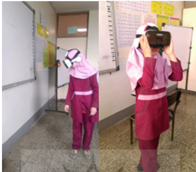
شکل ۲. اجرای مداخله روی آزمودنی‌ها

باید خالی از موانع و اشیاء در معرض سقوط باشد؛ چون غوطه‌وری در فیلم‌های پانورامیک زیاد است و ممکن است آزمودنی به صورت ناخودآگاه