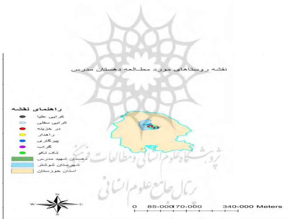
شکل (۲): نقشه روستاهای مورد مطالعه