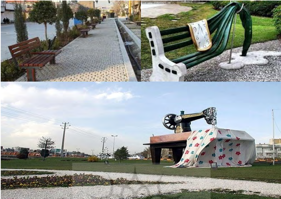
شکل (۲): نمونه مبلمان شهری در شهر کرج