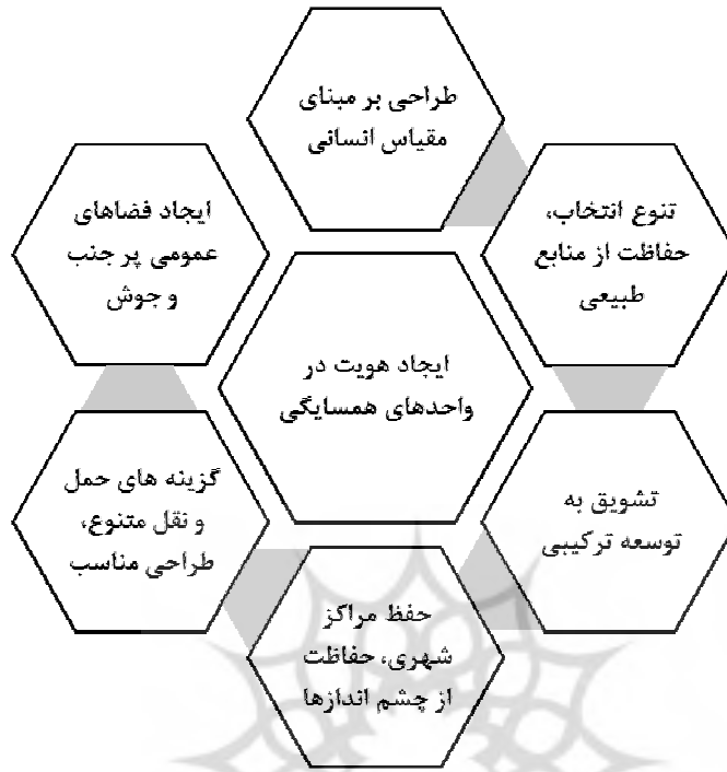
شکل ۲: معیارهای برنامه ریزی و طراحی مناطق و واحدهای همسایگی شهرهای زیست پذیر