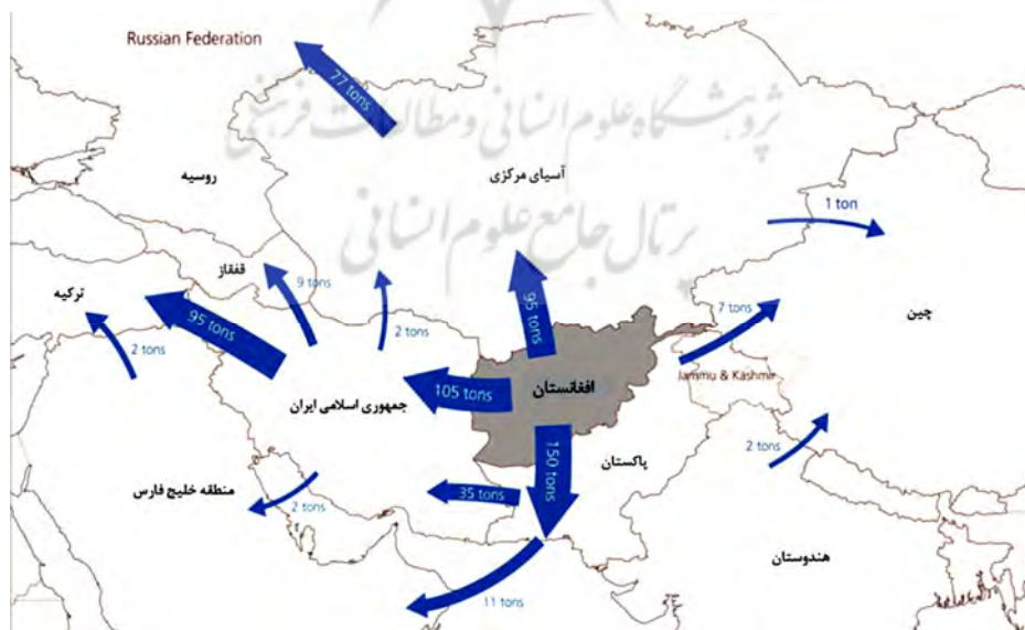
جدول شماره دو: مسیرهای ترانزیت مواد مخدر از افغانستان

به طور کلی مواد مخدر به چهار دلیل تحت تأثیر جغرافیا و ویژگی مکانی - فضایی مناطق قرار دارد. نخست مکانهای تولید مواد مخدر است که کانونهای جغرافیایی تولید را شامل می‌شوند، دوم مسیرهای ترانزیت مواد مخدر، سوم مکانهای مصرف و هدف که مقصد بیشتر قاچاقچیان می‌باشد و در نهایت چهارمین مورد شامل فضاهای جغرافیایی و افراد و گروه‌های می‌شود که تحت تأثیر بازتاب‌های تولید، ترانزیت و حتی مصرف مواد مخدر قرار دارند، مانند مناطق مرزی و گروه‌های جمعیتی ساکن در آنها که درگیر ترانزیت مواد مخدر هستند. علاوه بر این شناخت جغرافیای سیاسی مناطق عامل مناسبی در همکاریهای مقابله با تجارت مواد مخدر به شمار می‌آید (Danelo, 2011:14). جمهوری اسلامی ایران به همراه افغانستان و پاکستان از جمله مهمترین کشورهایی است که تحت تأثیر ژئوپلیتیک مواد مخدر قرار دارد. ایران با مصرف ۴۵۰ تن تریاک ۴۲ درصد از مصرف تریاک جهان و همچنین با مصرف ۱۷ تن هروئین ۵ درصد از کل مصرف هروئین جهان را به خود اختصاص داده است (UNODC, 2009:11). علاوه بر این ایران مهمترین مسیر ترانزیت مواد مخدر به اروپا است به طوری که بیش از ۸۰ درصد هروئین اروپا از طریق مسیر افغانستان - ایران - ترکیه - بالکان به اروپا می‌رسد. تک جداره بودن، کوتاهی مسیر و وجود فضاهای خالی نیز بخشی از امتیازات مسیر ایران است (کریمی پور، ۱۳۷۹:۱۵۱).