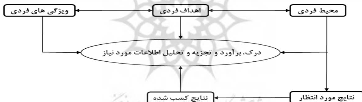
شکل ۲: مدل کارآفرینی شخصی در روستا (ادوارد، ۲۰۰۴، به نقل از زرگوش ۱۳۹۴).

بر کار خود خواهند داشت و برای استفاده از آن در جهت رفع نیازهای خود، از جمله نیاز به رشد و توسعه سالم فرصت های بیشتری به دست خواهند آورد. دوم آن که انسانی تر است، یعنی کار افراد و گروه‌ها نه تنها در زمینه اموری که با اهداف آنان بیگانه است مورد استفاده قرار نمی گیرد، بلکه موجب استثمار و زبان دیگران نیز نخواهد شد. سوم آنکه، با محیط زیست سازگارتر است، به این ترتیب کار محیط طبیعی و زیست انسانی هماهنگ خواهد بود و طبیعت را تخریب نخواهد کرد (رکن الدین افتخاری و سجاسی قیداری، ۱۳۸۹). توسعه و گسترش کارآفرینی در مناطق روستایی مشروط به توسعه فرهنگ کارآفرینی (بسترسازی جهت تربیت و پرورش کارآفرینان افراد روستایی، ترغیب افراد روستایی جهت مشارکت آنها در برنامه های کارآفرینی روستایی، تشویق سازمان‌های دولتی و غیر دولتی در پشتیبانی از برنامه های کارآفرینی در مناطق روستایی)، آموزش کارآفرینی (توانمندسازی روستاییان، برگزاری دوره های آموزشی کارآفرینی و مشاوره در این زمینه)، توسعه زیرساخت های کارآفرینی (فراهم آوردن اعطای دسترسی به سرمایه، اعطای وام به کار آفرینان، توسعه امکانات و تجهیزات حمل و نقل و گسترش سیستم های اطلاعاتی و ارتباطی، اتصال به منابع اطلاعات و دانش همگانی، گسترش امکانات زندگی در روستاها و مواردی از این قبیل است (اسکوبار، ۲۰۰۸، به نقل از زرگوش ۱۳۹۴).