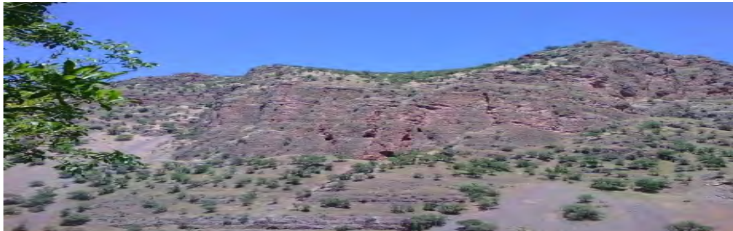
شکل ۶- گوردخمه روستای دشه