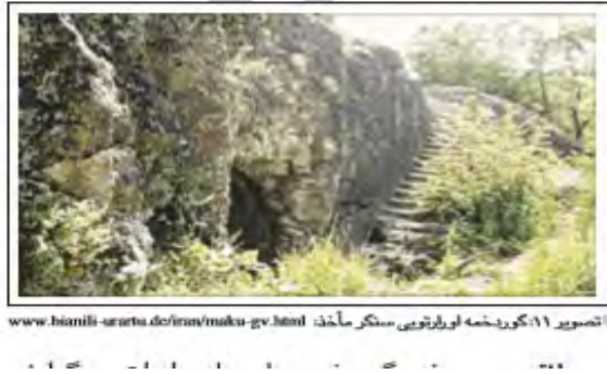
شکل ۵- گوردخمه ماد اورارتویی

طاقچه: در برحی از گر دخمه های ماد اورارتویی گزارش شده است. در گور دخمه سنگر ۵ طاقچه و در گور دخمه ورهرام ۷ طاقچه در اتاق اول گزارش شده است که در روی هر کدام یک ظرف قرار داشته است (کلیس ۶۱، ۱۳۵۴ و ۶۲)