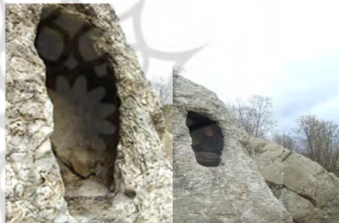
شکل ۳- گوردخمه های شهرستان پاوه، روستای نسمة

ای شجاع به خواب ابدی رفته و گاهی نیز مقبره کاهن و پارسایی بوده است. در نزدیکی شهر پاوه و در دامنه کوه آتشگا دخمه ای در دل صخره به یادگار مانده است این دخمه دارای ویژگیهای است از جمله قرار داشتن در محلی بلند و دور از دست رس که باید بوسیله نردبان وارد آن گردید همچنین نشیمن گاه و محل مشتسن در آن به صورت سکویی کنده کاری شده و نیز طوری ساخته شده که می توان سر را بر روی آن قرار داد و خوابید همچنین به صورت دوازده گوش می توان کاملاً در آن راحت خوابید این دخمه در دهانه ورودی دو حفره در دو گوشه دارد که جایی برای لولای درب بوده است تا بتوان بصورت عمودی دربی برای آن طراحی شده است را برای محافظت بست. این دخمه می تواند محلی برای نگهبانی نیز می تواند به کار رفته باشد دخمه باستانی پاوه در منطقه باستانی هفت سوار قرار دارد که غار بزرگ و تاریخی هفت سواران نیز در آن قرار دارد (مرادی عدنال، ۱۳۹۴)