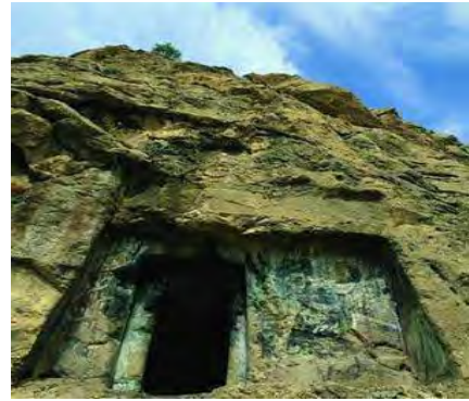
شکل ۱- گور دخمه های روانسر