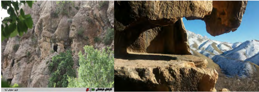
شکل ۴- تصویر گور دخمه روستای شمشیر

گوردخمه شمشیر در شهرستان پاوه، بخش مرکزی، دهستان شمشیر، ۱۵۰ متری شمال غربی روستای شمشیر واقع شده و این اثر در تاریخ ۲۵ آبان ۱۳۸۷ با شماره، ثبت ۲۳۸۴۹ به عنوان یکی از آثار ملی ایران به ثبت رسیده است